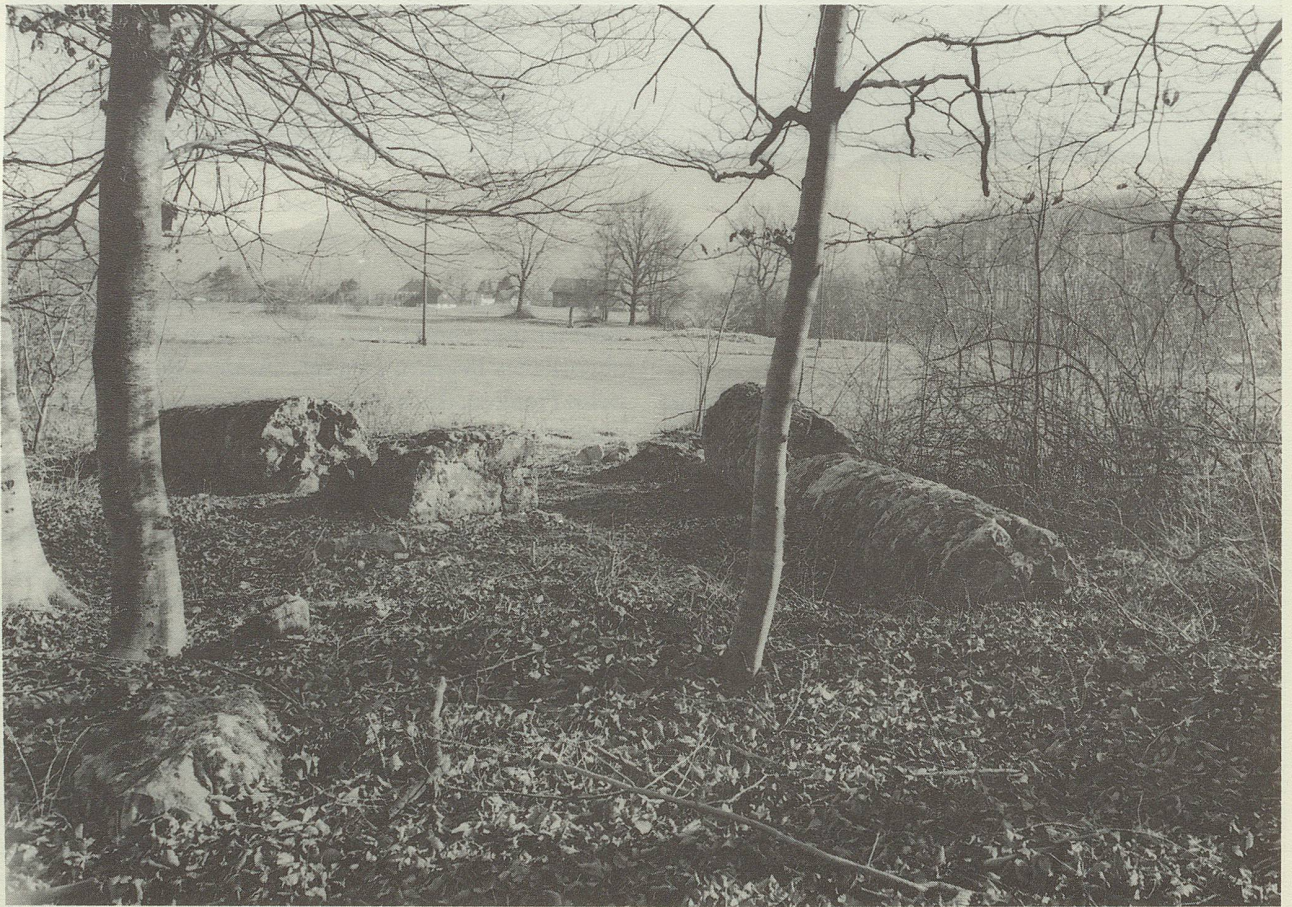
Sennwald-Salez: Parzelle 1675 mit den Resten des Galgens