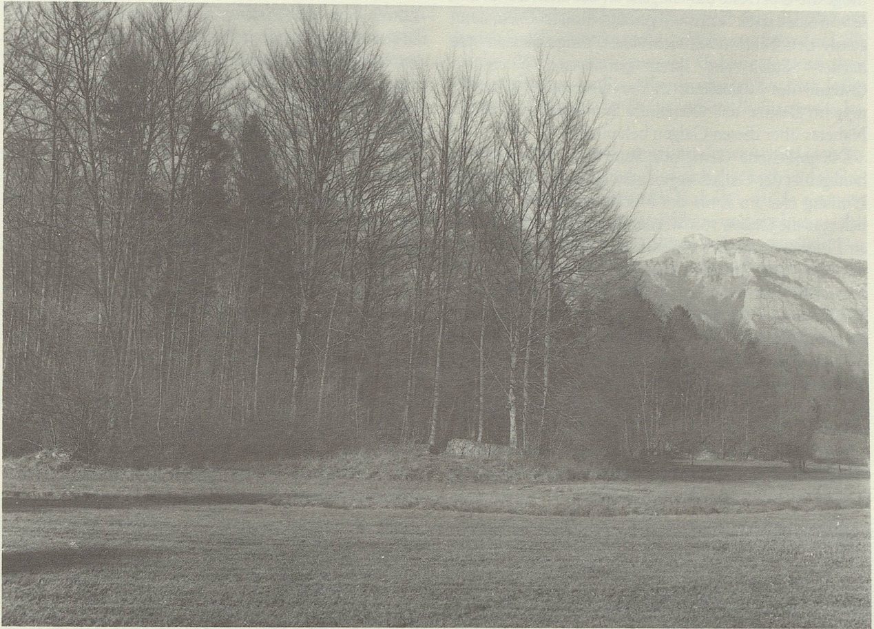
Sennwald-Salez: Galgenhügel in der Galgenmad