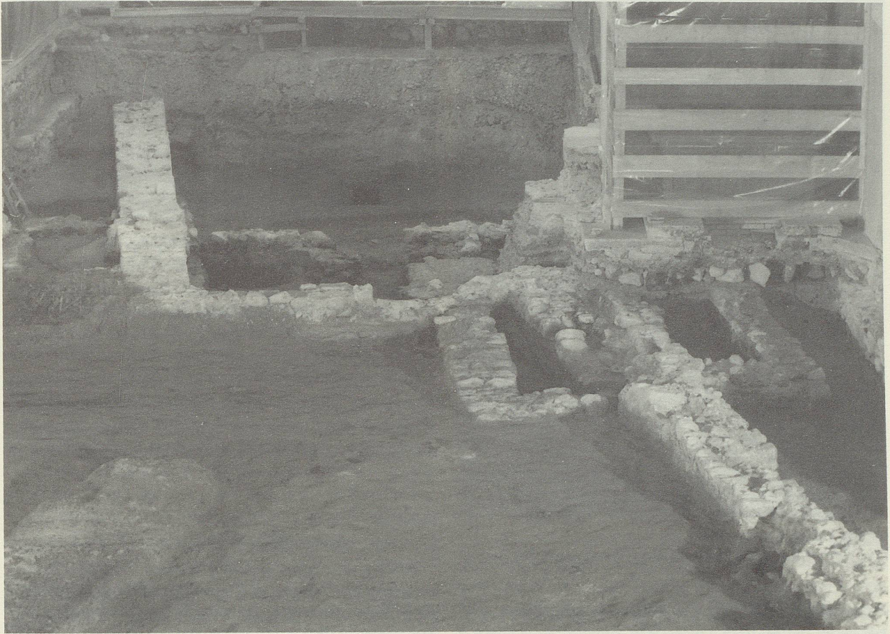
Gossau, Pfarrkirche St. Andreas Fundamente der Friedhofkapelle, des Beinhauses und der Immunitätsmauer