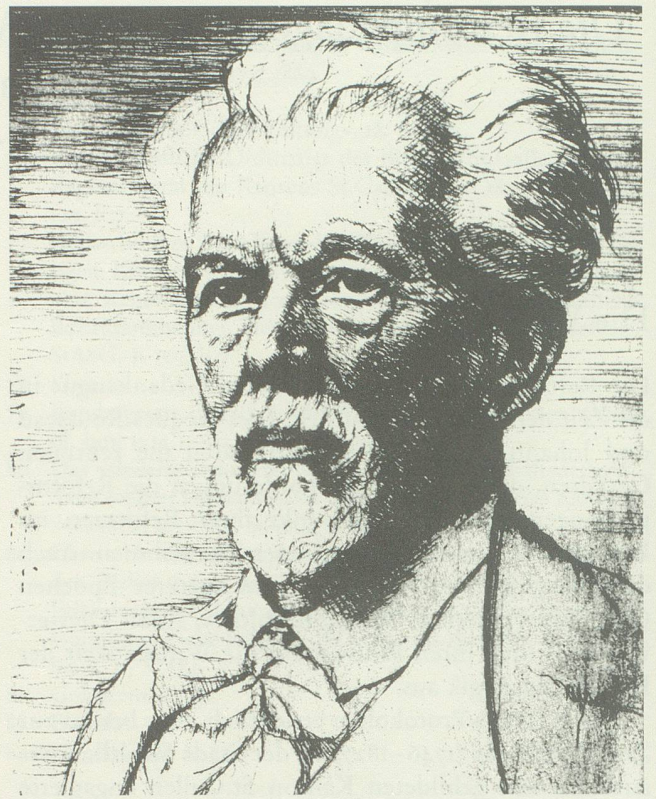
Georg Kerschensteiner (1854–1932), Initiant der Arbeitsschulbewegung (Original in der Stadtbibliothek München, publ. in: Klassiker der Pädagogik , Bd. 2, München 1979).

Da in der Schweiz die Schulhoheit in den Bereichen Volks- und Mittelschulen bei den einzelnen Kantonen liegt, ist es ein äusserst schwieriges Unterfangen, die Aufnahme und Entwicklung des reformpädagogischen Gedankengutes im Rahmen der Schweiz aufzuzeigen. Dies ist auch nicht die Absicht dieses Beitrages. Immerhin sollen doch ein paar Feststellungen gemacht werden: