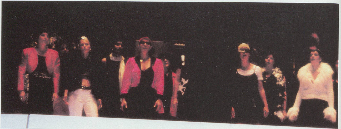
«Schneeweisschen und WerdeRot» an den Gay Games in Amsterdam 1998.

sozusagen eine verspätete 68er Geschichte.» Die HASG hatte in den besten Zeiten rund zwei Dutzend Mitglieder, darunter ganz wenige Frauen. Die Gruppe war eine Debatierplattform, führte aber auch öffentliche Aktionen wie Ausstellungen durch, ging in Schulen, untersuchte Schulbücher auf Gender-Darstellungen hin und stellte fest, dass weder Lesben noch Schwule darin vorkamen – was sich bis heute nicht verändert hat. Ein Vorstoss beim Lehrmittelverlag verschwand in der Versenkung. Einer der Höhepunkte war eine Strassendemo Ende der 1970er Jahre zum «Christopher Street Day» (CSD). 19 Die HASG war aber hauptsächlich eine Schwulengruppe und Alexandra trat nie direkt als Lesbe auf.