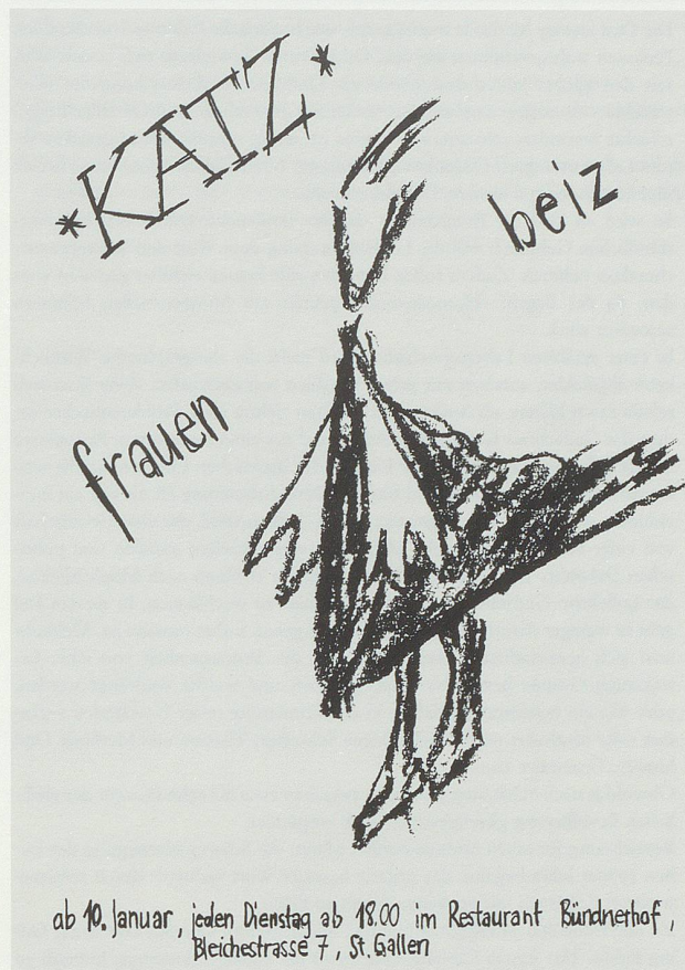
Eröffnungsblatt Frauenbeiz «Katz» vom Januar 1984.