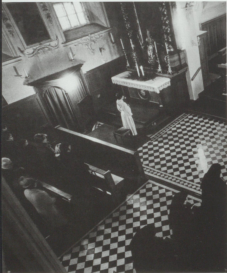
Die Ordensschwester setzen sich mit dem Konzilsdekret über die Erneuerung des Ordenlebens (Perfectae Caritatis) ab 1965 mit neuen Formen in der Begegnung mit Laien auseinander. Im Bild: Kapuzinerinnen des Klosters Notkersegg-St.Gallen feiern zusammen mit Laien im Kirchenschiff die Eucharistie.

Der politische Arm der Katholikinnen, die Gruppierung der CVP-Frauen, trat in dieser Hinsicht anders auf: Die politische Frauengruppe bot von Beginn weg eine mögliche Plattform für eine politische Karriere. Dies ist indessen kein spezifisches Phänomen des Bistums oder des Kantons St.Gallen. Dennoch, trotz dieser Plattform, weisen die meisten, auch die politisch assoziierten katholischen Frauen eine ähnlich unauffällige öffentlich-kirchliche Biografie auf. Dieses Phänomen ist auf dieselben, zuweilen sehr engen Rahmenbedingungen mit begrenztem eigenen Spielraum zur Entfaltung zunächst im kirchlichen, später auch im politischen Raum, zurückzuführen. Hinter dieser häufig nur mit dem Prädikat «Ehrenamt» ausgezeichneten Arbeit stehen auch in nachkonziliärer Zeit noch viel zu oft keine Namen der betreffenden Frauen. Ebenso fehlt eine gebührende Benennung dieser Leistungen weitgehend. Die Ehrenamtlichkeit und die häufig damit einhergehende übermässige Bescheidenheit dieser Frauen ist deshalb eine weitere und generelle Konstante, die sich bis in diese Tage hält. 43