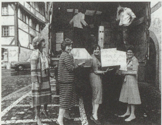
Frauen wählen für das geliebte Christentum häufig den pragmatischen Weg in der direkten und unbürokratischen Hilfe. Im Bild: Frauenbundsfrauen auf dem Gallusplatz vor dem sogenannten «Polenlastwagen» am Einpacken für die KFB-Aktion «Polen – Mütter in Not» von 1982.

Ein wichtiges kirchliches Gestaltungsgefäss für Frauen innerhalb der Kirche waren und sind seit Jahrzehnten die (voreucharistischen) Kinder-, Frauen-, und Wortgottesdienste. Innerhalb des traditionellen Verständnisses der Gottesdienstgestaltung wurde den Frauen mit den Frauengottesdiensten indessen nur bedingt eine eigene