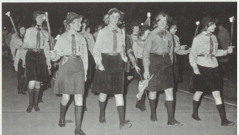
Eine bereits bestehende katholische Mädchengruppe schloss sich 1930 als Sektion St.Otmar der konfessionell neutralen Pfadfinderinnenabteilung der Stadt St.Gallen an. Im Bild: 50-Jahrfeier der Pfadfinderinnen von St.Gallen 1967 auf dem Klosterplatz.

dert bestehenden Frauen- und Müttervereine, sondern auch berufliche Standesvereine, die religiös und gemeinschaftlich lebenden Schwesternkommunitäten 1 sowie karitativ tätige Organisationen. Rein quantitativ gesehen, repräsentiert der KFB im Kanton St.Gallen die meisten katholischen Frauen. 2 Ab 1977 übernahm die neugegründete politische Arbeitsgruppe der Frauen der Christlich-demokratischen Volkspartei des Kantons St.Gallen (CVP-Frauen) zusätzlich zum KFB die Vertretung der politisch interessierten katholischen Frauen. 3 Neben dem KFB repräsentiert die im Bistum St.Gallen seit 1934 aktive Jugendorganisation Blauring eine weitere wichtige Gruppe von Katholikinnen: Die katholischen schulpflichtigen Mädchen und jungen Frauen. 4 Ebenso bestand in der Stadt St.Gallen innerhalb der Pfadfinderinnenabteilung seit 1930 ein katholisch-konfessioneller Pfaditrupp für Mädchen. 5