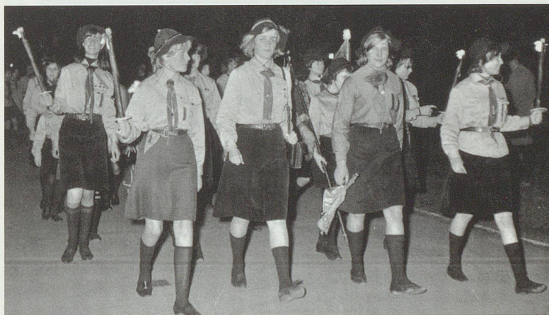
Eine bereits bestehende katholische Mädchengruppe schloss sich 1930 als Sektion St.Otmar der konfessionell neutralen Pfadfinderinnenabteilung der Stadt St.Gallen an. Im Bild: 50-Jahrfeier der Pfadfinderinnen von St.Gallen 1967 auf dem Klosterplatz.

dert bestehenden Frauen- und Müttervereine, sondern auch berufliche Standesvereine, die religiös und gemeinschaftlich lebenden Schwesternkommunitäten 1 sowie karitativ tätige Organisationen. Rein quantitativ gesehen, repräsentiert der KFB im Kanton St.Gallen die meisten katholischen Frauen. 2 Ab 1977 übernahm die neugegründete politische Arbeitsgruppe der Frauen der Christlich-demokratischen Volkspartei des Kantons St.Gallen (CVP-Frauen) zusätzlich zum KFB die Vertretung der politisch interessierten katholischen Frauen. 3 Neben dem KFB repräsentiert die im Bistum St.Gallen seit 1934 aktive Jugendorganisation Blauring eine weitere wichtige Gruppe von Katholikinnen: Die katholischen schulpflichtigen Mädchen und jungen Frauen. 4 Ebenso bestand in der Stadt St.Gallen innerhalb der Pfadfinderinnenabteilung seit 1930 ein katholisch-konfessioneller Pfaditrupp für Mädchen. 5