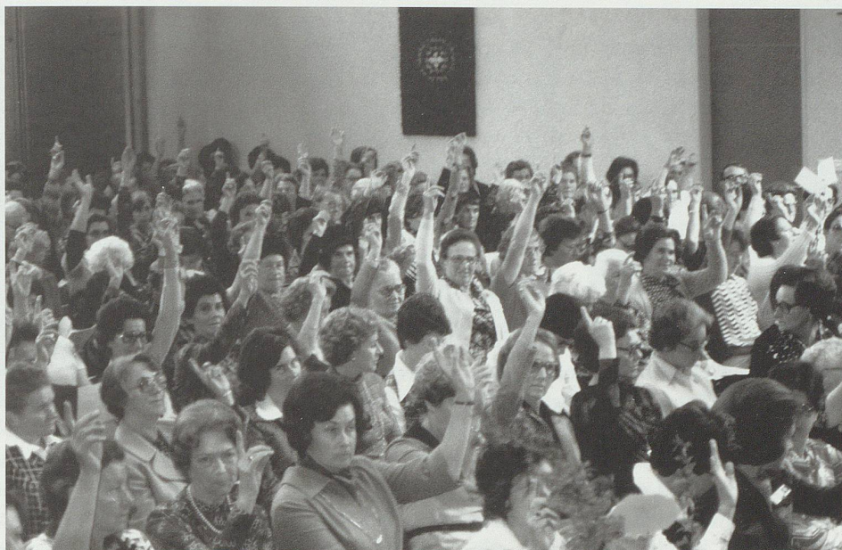
Katholische Frauen hatten bis zur Einführung des kirchlichen Stimm- und Wahlrechts für Frauen vom 25. Oktober 1970 ausschliesslich innerhalb der reinen Frauengruppierungen (KFB, Frauenklöster, religiöse Frauengemeinschaften) die Möglichkeit, von einem Stimmrecht Gebrauch zu machen. Im Bild: Abstimmung an einer Generalversammlung des KFB.