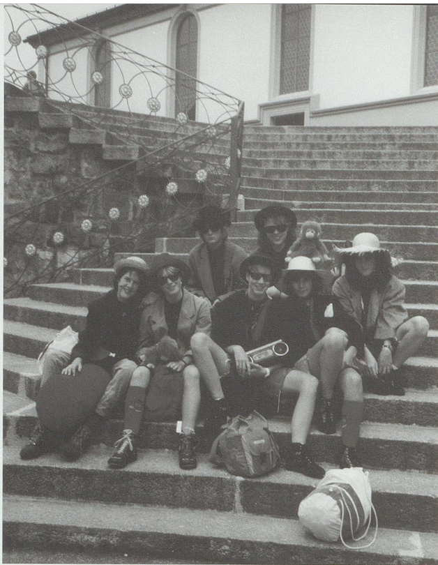
Katholisch-weibliche Jugendkultur der Blauringbewegung, deren religiöses Verständnis auch ausserhalb des traditionellen Kirchenraums seine Umsetzung findet. Im Bild: «Bläck-outs» aus der Pfarrei St.Gallen-Riethüsli im gemeinschaftsfördernden Gruppen- und Lagerleben 1991.