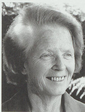
Hanny Thalmann: 1971 erste Nationalrätin der CVP des Kantons St.Gallen.