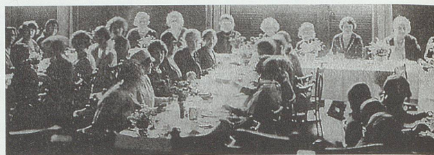
Hauptversammlung des BSIF in der Tonhalle St.Gallen.

Einladung zu einem Vortrag von Berta Pappenheim am 12. November 1924, organisiert vom Israelitischen Frauenverein St.Gallen.