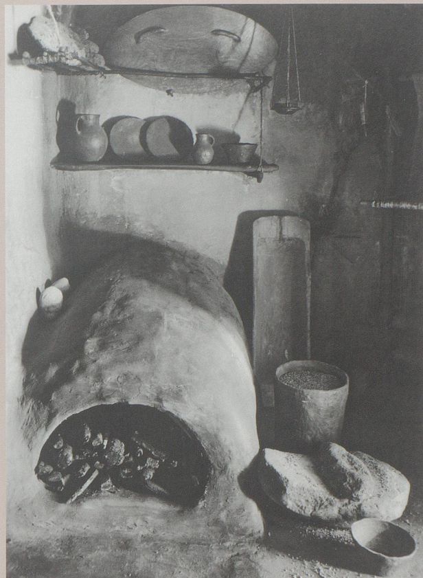
Herdstelle in der jungsteinzeitlichen Hütte der prähistorischen Abteilung.

Neben der finanziellen Absicherung des Unternehmens hatte nun die Heimatmuseumsgesellschaft vornehmlich der Raumfrage gebührende Aufmerksamkeit zu schenken. Nachdem der Plan, die Sammlung in dem aus dem späten 18. Jahrhundert stammenden repräsentativen Salvinihaus an der Marienbergstrasse unterzubringen, 1929 gescheitert war, fand sie einen vorläufigen Platz in einem Pavillon beim Bedaschulhaus. 1934 dann ergab sich für die Heimatmuseumsgesellschaft eine einmalige Gelegenheit: Sie erhielt als endgültiges Quartier für ihre Sammlung Räume im Ostflügel des Rorschacher Wahrzeichens, des Kornhauses. Ein idealer Platz für ein Museum, sowohl was die Lage am Hafen wie auch die räumlichen Erweiterungsmöglichkeiten anging.