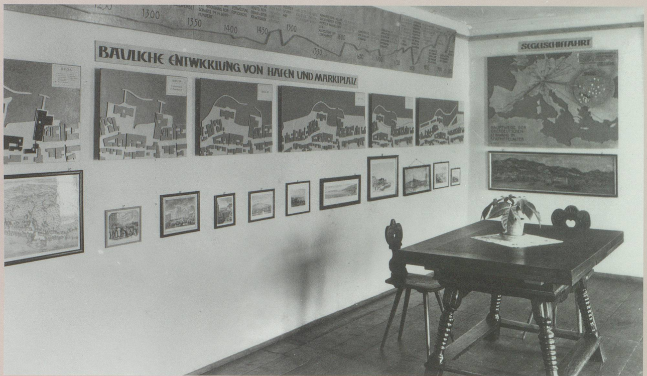
Abteilung in der Ausstellung «1000 Jahre Rorschach»: Bauliche Entwicklung von Hafen und Marktplatz. Aufnahme 1947.