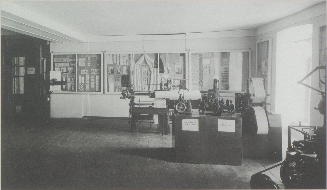
Blick in die Abteilung Stickerei-Industrie.

Gebäuden und wohlgestalteten Strassenzügen zum Ausdruck brachte. Mit einer Abteilung, wo Musterkollektionen von Stickereiartikeln und Stickereimaschinen zu sehen waren, welche die Besucher in die Geschichte jenes Produktionszweiges einführten, der in der zweiten Hälfte des 19. Jahrhunderts bis zum Ersten Weltkrieg für Rorschach eine massgebende Rolle gespielt und den Ort in eine Industriestadt verwandelt hatte, war der Museums-gesellschaft eine Pionierleistung gelungen. Bislang kam es nämlich nur selten vor, dass Heimatmuseen auch der Industriegeschichte Platz einräumten.