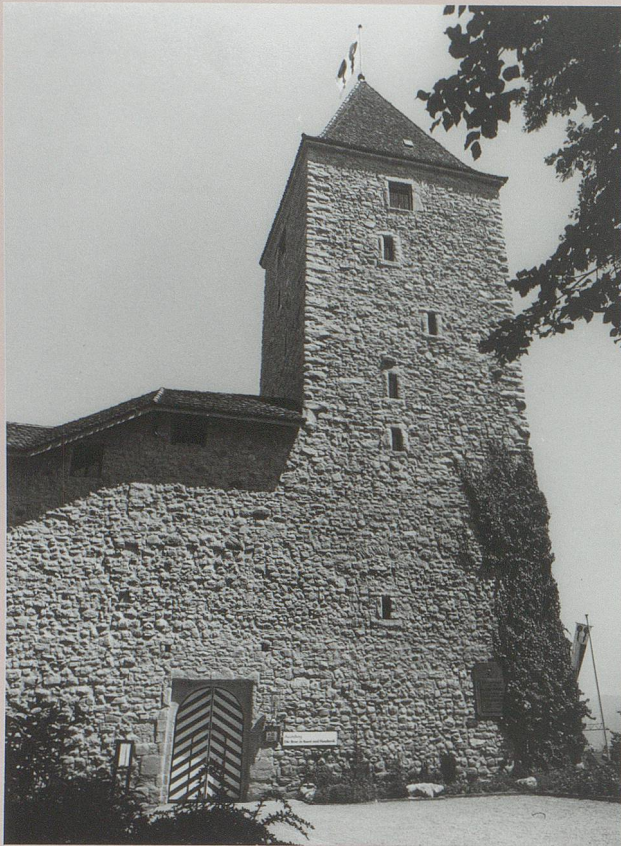
Schloss Rapperswil 1988, historischer und touristischer Anziehungspunkt der Stadtgemeinde Rapperswil-Jona.