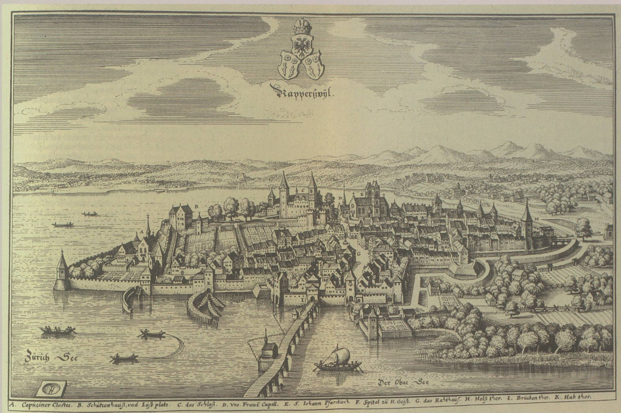
Rapperswil als kleiner Stadtstaat im 17. Jahrhundert, unter der Oberherrschaft der Schirmorte SZ, GL, UR, UW, Kupferstich von Matthäus Merian, 1642. (Kantonsbibliothek St. Gallen)

Dies gelang zu allererst in der Stadt Rapperswil, die grössere Eigenständigkeit genossen und reiche Archivbestände über alle Jahrhunderte bewahrt hatte. Aber auch hier schweifte der Blick nur selten über die eigenen Mauern hinaus. Dank der mittelalterlichen Bedeutung von Burg und Stadt und des Selbstbewusstseins der Bürger, besonders aber dank der gebildeten Stadtschreiber und Geistlichen, entstanden seit dem 15. Jahrhundert die ersten Chroniken, die 1854 durch die wissenschaftliche «Geschichte der Stadt Rapperswil» von Xaver Rickenmann eine Krönung fanden. 2