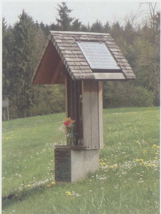
Kollektoren für jedermann... Wegkreuz bei Niederglatt.

Ökologische Nachhaltigkeit bedeutet, Natur und Umwelt für die nachfolgenden Generationen zu erhalten. Dies umfasst den Erhalt der Artenvielfalt, den Klimaschutz, die Pflege von Kultur- und Landschaftsräumen in ihrer ursprünglichen Gestalt sowie generell einen schonenden Umgang mit der natürlichen Umgebung. «Die Gemeinsamkeit aller Nachhaltigkeitsdefinitionen ist der