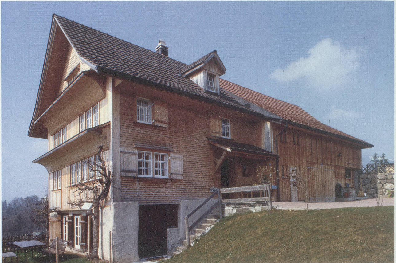
Gommiswald, Risisberg. Ein Bauernhaus, das seinen Charakter durch die Gesamtrenovation nicht verloren hat (Foto: kant. Denkmalpflege).

Erhalt eines Systems bzw. bestimmter Charakteristika eines Systems, sei es die Produktionskapazität des sozialen Systems oder des lebenserhaltenden ökologischen Systems. Es soll also immer etwas bewahrt werden zum Wohl der zukünftigen Generationen.» 1