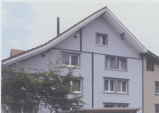
Alterswil und Bichwil. Durch die sehr tiefen Fensterleibungen verschwinden schon beim kleinsten Blickwinkel die Fenster und wirken wie Löcher; die Kopfhölzer des Dachvorsprungs versinken in der Isolierschicht.