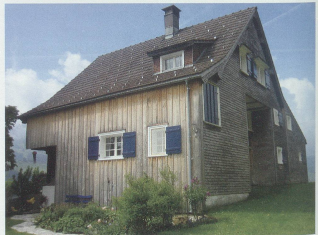
Wildhaus, gelungener Umbau in Steinrüti.