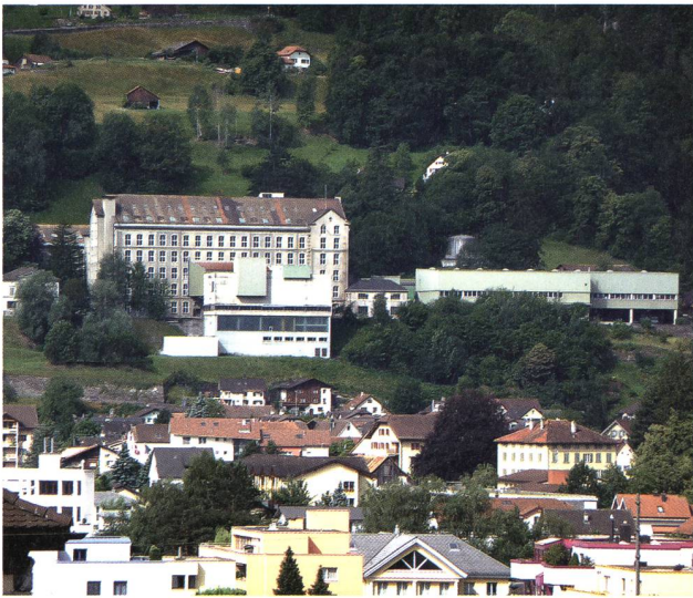
Zwei «Industrieschlösser», die ihre Dörfer architektonisch dominieren: Die 1866 erbaute Spinnerei Spoerry in Flums und die 1875 erbaute Spinnerei Stoffel in Mels.