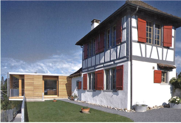
Der sorgfältige Umgang mit dem Baudenkmal beinhaltet auch seine Umgebung. Das Rebhäuschen an der Fluhstrasse in Kempraten (Rapperswil-Jona) hat durch BGS Architekten Rapperswil einen Partner erhalten, der trotz der intimen Nähe den historischen Kleinbau nicht bedrängt, sondern ihn in seiner leichten, pergolaartigen Bauweise in spielerischer Weise ergänzt. (Foto: BGS Architekten, Rapperswil)