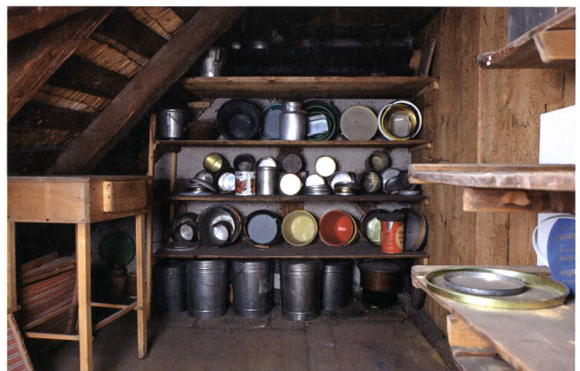
Die Alte Post in Weisstannen hat eine bewegte Geschichte hinter sich. Als Verwaltungsgebäude für das Kloster Schänis erbaut, ist sie der einzige Steinbau im Tal. Zuletzt hatte sie als Postlokal gedient. Nach 20 Jahren Leerstand soll unter Einbezug des reichhaltigen Sammelsuriums an Gegenständen, das sich in ihr angesammelt hat, dank der Stiftung Erlebnis Weisstannental ein interaktives Museum entstehen.