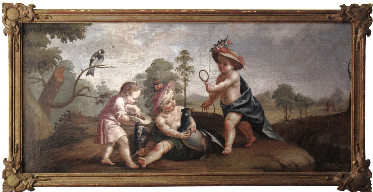
Im unschuldigen Spiel halten uns barocke Putten den Spiegel vor, wecken oder kompensieren Sehnsüchte nach ungezwungener Lebensweise. Zu Zeiten des Klosters schmückten diese Supraporten die Türen im Regierungsgebäude, im 20. Jahrhundert interessierte sich kaum mehr jemand für sie. Dank der Nachkommen des Restaurators Walter Vogel konnte die Denkmalpflege zwei seinerzeit weggegebene Supraporten zurückerwerben.

wird laufend Land verbaut, es muss ein Anspruch von immer mehr Wohnraum erfüllt, ein steigendem Bedarf an Gewerbe- und Arbeitsflächen befriedigt und natürlich auch ein Ausbau der Freizeitindustrie ermöglicht werden. Wachstum gegen das Einschlafen. Die Raumplanung fordert zu Recht einen Stopp der Zersiedelung. Doch für uns bedeutet dies oft eine Verlegung der Bautätigkeit auf die historischen Zentren. Die in den Schutzverordnungen deklarierten Ortsbilder und der Bestand an prägenden, in der Regel aber nicht eigens geschützten historischen Bauten darin ist gefährdet wie nie zuvor. Ging es früher um die Auseinandersetzung ob in einem alten Haus ein Parkett knarren darf, geht es heute um das Sein ganzer Ensembles und um den Schein ihrer Nachfolgebauten. «Verdichtung» heisst das Zauberwort. Und Verdichtung fordert letztlich, dass in Ortsbildschutzgebieten grossflächig abgebrochen und zu vieles durch Neues ersetzt wird. «Verdichtung» wird auch zum Anlass genommen in jedem Estrich und den von der Landwirtschaft ausgemusterten Bauten neuen Wohnraum zu schaffen. Was ja gut gemeint ist, in der Regel bei Dachstöcken aber zu erheblichen Auswirkungen auf den Charakter der Dachland-