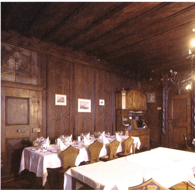
Schloss Sargans, Gaststube mit gotischem und barockem Täfer.