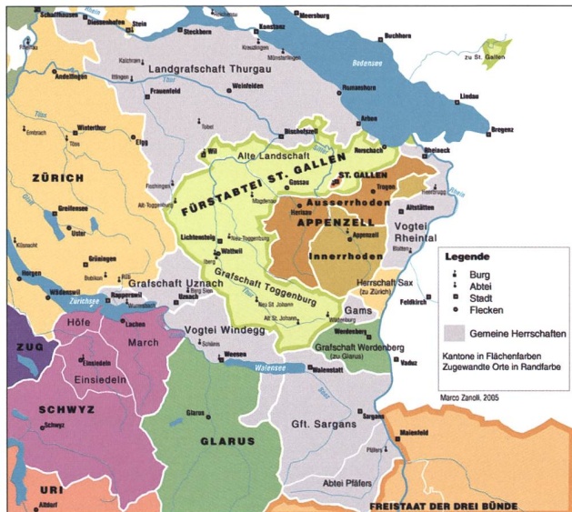
Karte der Ostschweiz mit den Herrschaften vor 1798.