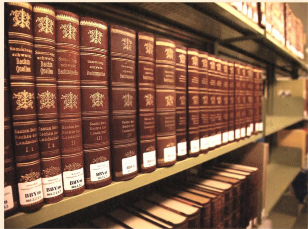
Die Bände der Sammlung Schweizerischer Rechtsquellen in der Präsenzbibliothek des Staatsarchivs St.Gallen

spiegelt sie den Wandel des Rechtsquellenbegriffs ebenso wie die Veränderungen des disziplinären Selbstverständnisses der Rechtswissenschaft im Allgemeinen und der Rechtsgeschichte im Besonderen wider. Edierte Rechtsquellen sind auch für die akademische Lehre ein wertvolles Arbeitsinstrument. Sie eignen sich für die exemplarische Analyse zentraler Fragen der vormodernen Geschichte und ebnen den Studierenden den Weg für die Beschäftigung mit den kulturell andersartigen Verhältnissen der Zeit vor 1800. Benutzerinnen und Benutzer können leicht auf das zentrale Quellenmaterial zugreifen, das mit den Fachkommentaren und dem Glossar der Bandbearbeiterinnen und Bandbearbeiter erschlossen und in den historischen Kontext gestellt ist.