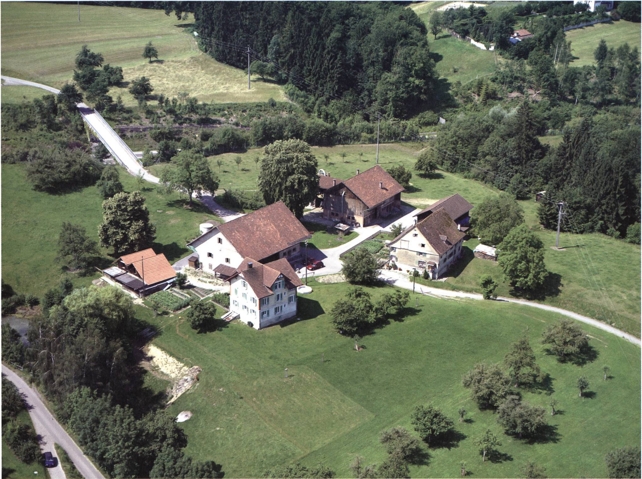
Meierhof Berg.

nach wurden ebenfalls nicht berücksichtigt, da ein separater Band mit den Uznacher Rechtsquellen geplant ist. Zum dritten Teil gehören auch die beiden Bände Sarganserland und Rheintal, die in Entstehung begriffen sind, sowie ein Band zur Region Werdenberg, die demnächst bearbeitet wird (vgl. die Beiträge von Sibylle Malamud, Werner Kuster und Hans Jakob Reich in diesem Neujahrsblatt).