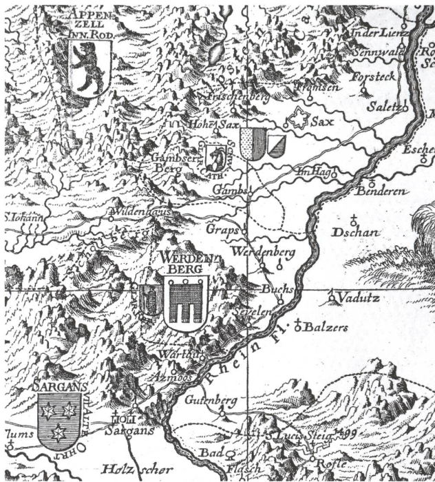
Auf der «Nova Helvetiae tabula geographica» (Johann Jakob Scheuchzer, 1712) sind die unterschiedlichen Herrschaftsverhältnisse mit den beigefügten Wappen der Obrigkeiten oder mit Umschriften angedeutet.

Wartau sowie die Archive der Orts- und Kirchgemeinden der Region Werdenberg und das Kulturarchiv Werdenberg zu besuchen und auszuwerten. Ebenfalls berücksichtigt werden müssen die Ortsarchive der Nachbarregionen Liechtenstein, Toggenburg, Rheintal und Sarganserland, wobei zu diesen zum Teil bereits Erschliessungsarbeiten aus früheren Rechtsquellen- und anderen Editionsprojekten vorliegen. Wertvolle Synergien im Bereich der Recherche ergeben sich zweifellos aus einer engen Zusammenarbeit mit den Bearbeitenden des im Juni 2011 begonnenen, auf sechs Jahre angelegten Projektes Kunstdenkmäler Werdenberg. 5 Zudem beherbergen zahlreiche auswärtige Archive Materialien, die es zu sichten gilt, so die Staats- und Landesarchive Aargau, Luzern, Graubünden, St.Gallen, Schwyz, Zürich, Appenzell, Glarus, Thurgau und Liechtenstein, ebenfalls die Diözesanarchive Chur und St.Gallen, die Stadtarchive Feldkirch und Lindau sowie das Vorarlberger und das Tiroler Landesarchiv. Somit umfasst das Untersuchungsgebiet mindestens 40 öffentliche Archive, und zweifellos wird im Lauf der Arbeit der eine oder andere interessante private Bestand zum Vorschein kommen. Pascale Sutter ist jedenfalls