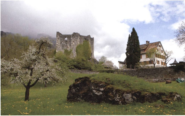
Die Burg Forstegg, um 1375 von den Herren von Sax-Hohensax erbaut und von 1615 bis 1798 Sitz der Zürcher Landvögte in der Freiherrschaft Sax-Forstegg.

einigung der Region Werdenberg (HHVW) mit je 5 000 Franken ebenfalls dazu bei, dass die Arbeiten 2013 aufgenommen werden können.