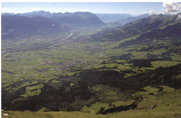
Blick vom Mutschen auf (von links) Gams (mit dem Weiler Gasenzen), Grabs, Buchs und im Hintergrund am Hangfuss Sevelen. Gams gehörte ursprünglich zur Freiherrschaft Sax, wird im 14. Jahrhundert infolge einer Dreiteilung dieser Herrschaft zur Herrschaft Hohensax und 1497 zur Gemeinen Herrschaft der Orte Schwyz und Glarus bzw. zum von der Landvogtei Gaster aus verwalteten Amt Gams.

Das Rechtsquellenprojekt Werdenberg versteht sich zum einen als Fortsetzung des Anfang der 1980er-Jahre eingestellten «Urkundenbuchs der südlichen Teile des Kantons St.Gallen» (publiziert 1951–1982), das den Zeitraum vom 2./3. Jahrhundert bis 1340 beinhaltet. Zum andern bildet es eine Ergänzung des Liechtensteinischen Urkundenbuches (1948–1996) und des Bündner Urkundenbuches (1955–2005), des Chartularium Sangallense (publiziert ab 1983) und der kurz vor der Edition stehenden Rechtsquellen des Sarganserlandes. Für die Grafschaft Werdenberg,