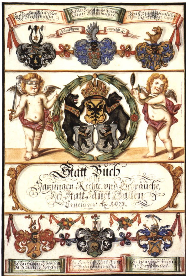
Zweites Stadtbuch von St.Gallen, 1426–erste Hälfte 16. Jh.: «Von den webern und von der linwât», fol. 14r. Stadtarchiv St.Gallen, Bd. 540; SSRQ SG III/11, S. 115–116.

für das Handwerk und das Gewerbe der Stadt St.Gallen einen Markstein und den vorläufigen Abschluss einer Rechtsentwicklung, die im 14. Jahrhundert begonnen hatte. Es enthält in seinem 14. Teil die Satzungen und Ordnungen des Leinwandgewerbes und im 15. Teil die Bestimmungen über Zunft- und Handwerkssachen; in einem umfangreichen Abschnitt werden hier alle Gesetze, Regeln, Gebote und Verbote, Gebräuche, Rechte und Pflichten zusammengefasst. – In diesem und den folgenden Geschäftsberichten der Ersparnisanstalt der Stadt St.Gallen sollen aus dieser «Gesetzessammlung» oder «Gemeindeordnung», in der sich polizeiliche, zunftrechtliche