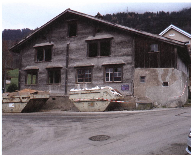
Quarten, Dorfsasse 8: ein bald 500jähriges Haus. Durch die dendrochronologische Holzaltersbestimmung konnte das Baujahr 1530 ermittelt werden.

mit konnten nebst 7 Dokumentations- und Teiluntersuchungen insgesamt 11 Bauuntersuchungen und 18 Holzaltersdatierungen vorgenommen werden. Baugeschichtliche Untersuchungen dienen dazu, ein Gebäude besser zu kennen, es zu verstehen und somit die Planung der Massnahmen auf eine wissenschaftlich gesicherte Grundlage zu stellen. Dennoch sind baugeschichtliche Untersuchungen leider oft auch die letzte Dokumentation eines historischen Zustandes, denn Umbauten und Renovationen – auch sorgfältige – mindern immer die Bausubstanz, die ja schlussendlich die Trägerin der geschichtlichen Spuren ist.