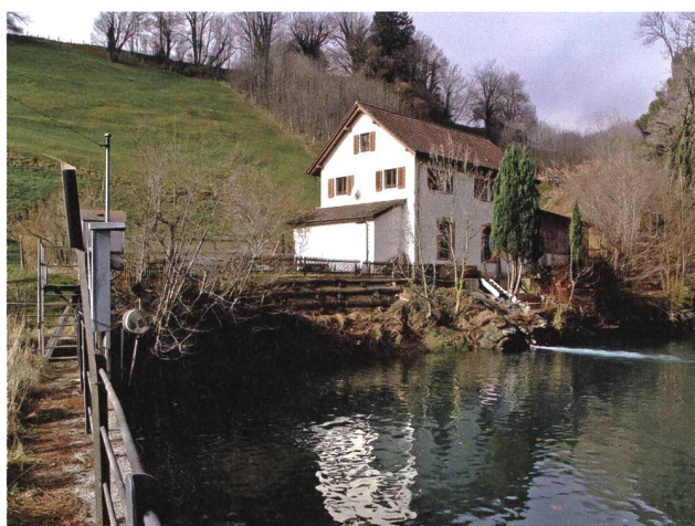
Wartau, Elektrizitätswerk Oberschan, ein neu entdeckter Zeuge der Industriekultur. Foto Kunstdenkmälerinventarisierung.

An Grundlagenarbeit dürfen wir vor allem die Bauernhausforschung und das Mitte 2011 wieder aufgenommene Projekt Kunstdenkmälerinventarisierung nennen. Für den Kunstdenkmälerband Werdenberg ist die Gemeinde Wartau nun fertig bearbeitet, termingerecht liegt das Manuskript vor und man freut sich auf die nächsten Einblicke.