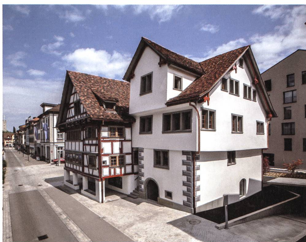
Rheineck, Krone und Laterne nach Jahren der Verlotterung frisch renoviert. Foto architekten : rlc ag, Rheineck.

mern, Planenden, Handwerksleuten und Restaurierungsfachleuten vermerken. Es sind Beispiele, die Mut machen, anregend und – hoffentlich – auch ansteckend wirken. Ganz besonders erfreulich ist der gelungene Abschluss der Renovations- und Erneuerungsarbeiten im Kronenareal Rheineck, gerade weil diese Aufgabe anfänglich so schwerfällig anlief, weil die Hürden zeitweise unüberwindbar schienen und weil die Bauten als hoffnungslos baufällig bezeichnet wurden. Auch die Krone wurde für einen «Schandfleck» gehalten – aus ihr ist ein Vorzeigebau geworden.