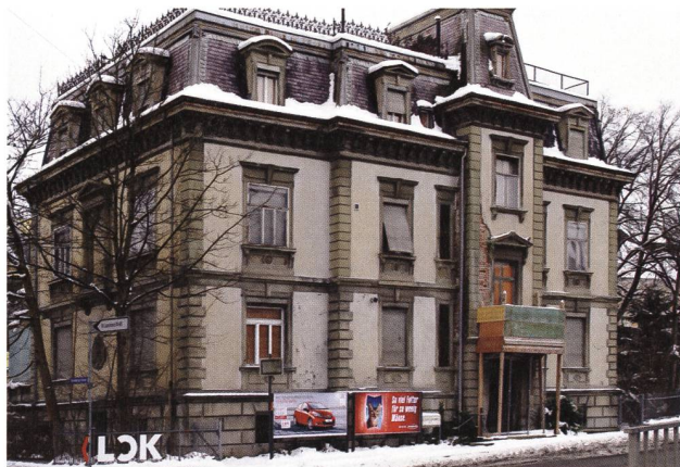
St.Gallen, Villa Wiesental, Taktik der Verlotterung 2012.

Schon wieder ein vergangenes Jahr und damit eine Chance, um über unsere Tätigkeit zu berichten. Schon wieder die Erwartungshaltung, mit kreativen Ideen, vielleicht mit wegweisenden Projekten aufzeigen zu können, wie zeitbewusst, wie zukunftsgerichtet die Denkmalpflege handelt. Denn unser Antrieb ist das Bewusstsein um die kommenden Generationen und ihren Anspruch auf ein ungeschmälertes kulturelles Erbe. Obschon wir uns intensiv um Verständnis, Wertschätzung, Sicherung und denkmalchonforme Nutzung des historischen Erbes bemühen, scheint der Zeitgeist dennoch gegen uns zu wirken. Tiefe Zinsen und Neubauten als lohnendste Anlagemöglichkeit sowie energiesparende Investitionen machen es noch schwieriger, Ortsbilder zu bewahren und den Bestand an