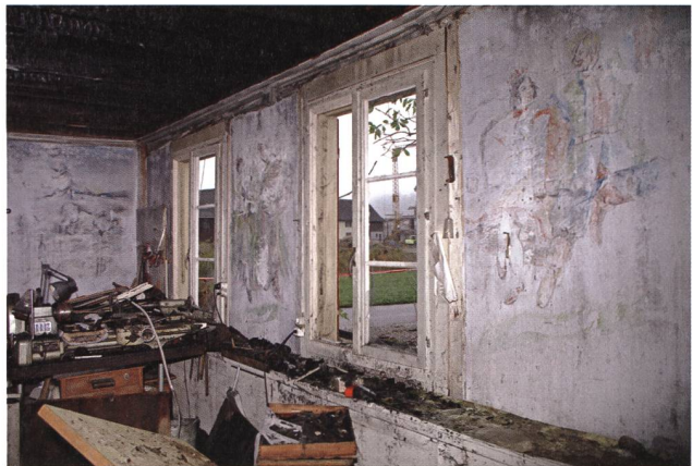
Gleich mehrere Brände an Schutzobjekten waren im Jahr 2012 zu beklagen. In Niederbüren gingen durch einen Brand Kreidezeichnungen von internierten Polen aus dem 2. Weltkrieg verloren.

galt der Villa Wiesental im Rahmen der vom Verein Pro Villa Wiesental Anfang 2012 lancierten Petition, die in kurzer Zeit die sensationelle Zahl von fast 4000 Unterschriften für die Erhaltung der Villa zusammenbrachte.