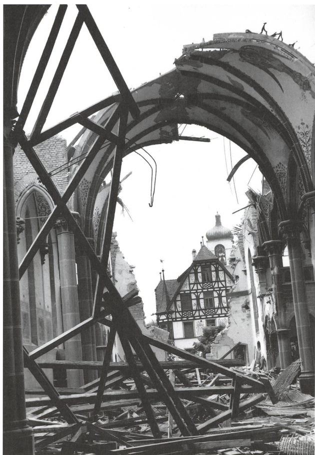
Gossau, Schutzengelkirche, Abbruch 1972.

Kulturobjekten zu sichern. Seit dem denkwürdigen Abbruch der Schutzengelkirche in Gossau sind nun 40 Jahre verflossen – aus heutiger Sicht eine Untat, die man keinesfalls wiederholen würde! Nicht wiederholen würde? Sind wir uns dessen ganz sicher? Zurzeit argumentieren jene, die den Abbruch der schutzwürdigen, hochwertigen Villa Wiesental in St.Gallen befürworteten, mit denselben Argumenten wie jene in Gossau vor vierzig Jahren: Das Haus sei nicht mehr zeitgemäss, es befinde sich in einem (von den Eigentümern verschuldeten) schlechten baulichen Zustand und die Umgebung sei verdorben: Da helfe nur ein kühner Neubau, ein zeitgemässes Manifest, von dem man sich einen neuen Auftakt für das Stadtmarketing erhofft. Die denkmalzerstörerische Stimmung erinnert an den ungebändigten Drang zum steilen Aufschwung, wie ihn die Nachkriegsjahre mit sich gebracht hatten. Die Antwort darauf war das «Europäische Jahr für Denkmalpflege und Heimatschutz» im Jahre 1975. Haben wir die damaligen Erkenntnisse, die guten Grundsätze und das Einvernehmen, uns mehr für das kulturelle Erbe einzusetzen, gänzlich vergessen? In dieses ohnehin schwierige Umfeld platzt – nicht ganz unerwartet – das aus Spargründen geschnürte Entlastungspaket III, welches an der ohnehin schon schwachen Dotierung der Denkmalpflege zu nagen droht.