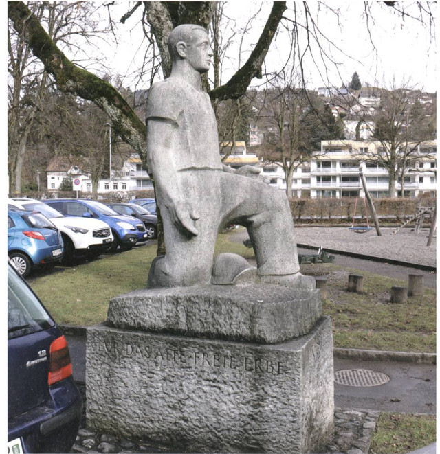
Wattwil. Beim Parkplatz des Restaurants und Kongresshauses Thurpark (Volkshausstrasse). Das Monument von 1951 steht im Weg, ist in seiner Bedeutung verblasst oder gar unbekannt und der junge Soldat führt heute seinen Abwehrkampf gegen die Zeichen der Moderne. Foto 2014, Johannes Huber, St. Gallen.

schlug auf dieser Versammlung vor, zu Ehren der verstorbenen Toggenburger Kameraden des gerade zurückliegenden Kriegs ein Denkmal zu stiften. Kalberers Antrag und die später erfolgenden Gedenkzeremonien am Monument verdeutlichen, dass die Aktiven des Ersten Weltkriegs bezweckten, in diesem Denkmal ein sichtbares Zeichen der unsichtbaren Bande und Solidarität zwischen den Wehrmännern und Verstorbenen beider Kriege zu setzen.