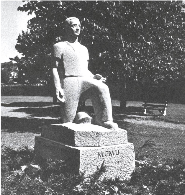
Wattwil. Nähe Volkshaus. Soldatendenkmal, errichtet von Aktiven des Ersten Weltkriegs für die Aktiven des Zweiten Weltkriegs. 1951 enthüllt und eingeweiht. Foto 1953. Quelle: Bucher: In Memoriam , S. 42.