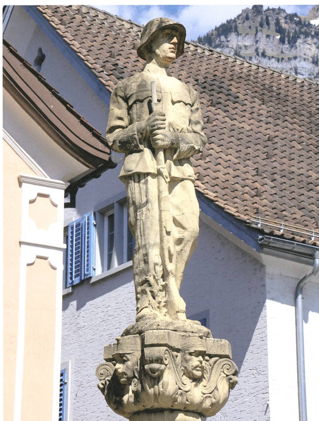
Walenstadt. Brunnen vor dem Rathaus, Detail mit wachendem Soldat und (am Kapitellsockel) Gesichtsmasken ranghoher Schweizer Armeeeoffiziere. Foto 2013, Johannes Huber, St. Gallen.

cher von Bernegg (1850–1927). 9 Die dritte Figur ist nicht mehr eindeutig zu identifizieren. 10