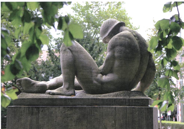
St. Gallen. Soldatendenkmal im Kantonsschulpark, 1921 enthüllt. Foto 2012, Johannes Huber, St. Gallen.

sowie zahlreicher Zuschauerinnen und Zuschauer feierlich enthüllt. Festansprachen hielten aus diesem Anlass Oberstleutnant Heitz und Landammann Albert Mächler (1868–1937).