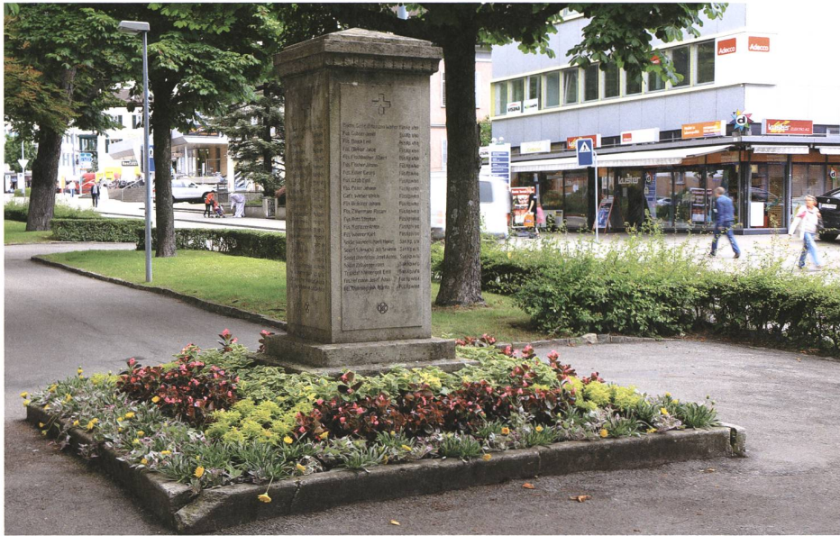
Wil. Soldatendenkmal vor dem Alleeschulhaus, 1921 enthüllt.

einem Bildhauer Schoch ausgeführt wurde und auf altem Boden der Ortsgemeinde steht, sind die Namen von 77 Männern des Korpssammelplatzes Wil (vor allem aus der Gegend von Wil sowie aus dem Toggenburg und aus Thurgauer Gemeinden) vermerkt, die während des Kriegs verstorben sind. Von den in diesem Beitrag besprochenen Denkmälern handelt es sich bei demjenigen in Wil formal um das einfachste Beispiel; es erhebt keinen bildhauerischen Anspruch, sondern ist die handwerklich saubere Lösung eines lokalen Meisters. Umso mehr erhebt es jedoch einen politischen Anspruch: «Und der einfache Denkstein, der die Namen unserer verstorbenen «Brüder» auf sich trägt, wird in spätern Jahrzehnten noch jene, die die Inschriften unserer verstorbenen Wehrmänner lesen, an die Zeiten der Grenzbesetzung erinnern, und zwar so wie der Denkstein selbst, den Eindruck erweckt: einfach und ernst im Äussern, doch tief und treu aus dem Innern heraus.» (Wiler Zeitung, 1. Oktober 1921)