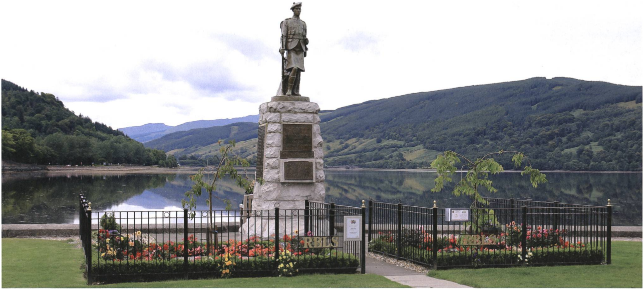
Inveraray (Scotland, Isle of Arran), war memorial. Kriegerdenkmal zu Ehren der aus Inveraray stammenden und während des Ersten Weltkriegs Gefallenen. Grundkonzept 1920er-Jahre, spätere Beifügungen in Erinnerung an die Gefallenen des Zweiten Weltkriegs, Umzäunung wesentlich später. Foto 2013, Johannes Huber, St. Gallen.

Bereits in den offiziellen Dokumenten der frühen 1920er-Jahre, als die sankt-gallischen und appenzellischen Erinnerungszeichen entstanden, wird, soweit die Quellen für diesen Beitrag ausgewertet werden konnten, nie von Kriegerdenkmälern gesprochen. In Gebrauch standen bereits damals Bezeichnungen wie «Soldatendenkmal», «Denkmal» oder «Denkstein», «Erinnerungszeichen». Die Symbolik des wehrhaften Staates verband sich mit dem Bedürfnis des solidarischen Gedenkens und Denkens (an die verstorbenen Wehrmänner und ihre Hinterbliebenen), der Erinnerung und des erklärten wie versprochenen kameradschaftlichen Nichtvergessens. Und genau dies dürfte der lautere, aus heutiger Zeit vielleicht etwas übertrieben wirkende, aber doch ursprüngliche Antrieb zur Errichtung von Denkmälern für Soldaten gewesen sein. Grundsätzlich drängte sich für die Dahingegangenen nämlich kein Denkmal auf: Sie alle hatten ja zuvor eine ehrenvolle Beisetzung erhalten – nicht etwa wie jene ungezählten Soldaten der Kriegsstaaten, die auf den Schlachtfeldern von explodierenden Granaten untergepflügt worden waren und seither als verschollen galten.