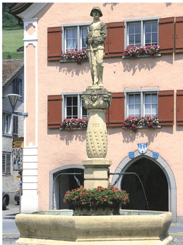
Walenstadt. Brunnen vor dem Rathaus, gestaltet als Soldatendenkmal. 1920 erbaut, 1921 eingeweiht. Foto 2013, Johannes Huber, St. Gallen.

Die formale Bewältigung der gestalterischen Aufgabe ist – verglichen etwa mit der Lösung Wil – eher komplex und auffallend retrospektiv. Die konventionelle Brunnenform mit mehreckigem Trog und zentraler Brunnensäule erinnert noch stark an den Barock. Der aus dem Stock emporwachsende, zapfenförmig sich verdickende Schaft und das darauf ruhende Kapitell hingegen sind trotz Voluten und sich einrollendem Akanthus sehr vom