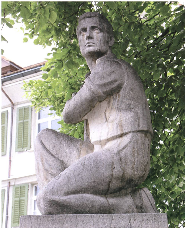
Herisau. Soldatendenkmal am Platz bei der evang. Kirche, 1921 enthüllt.