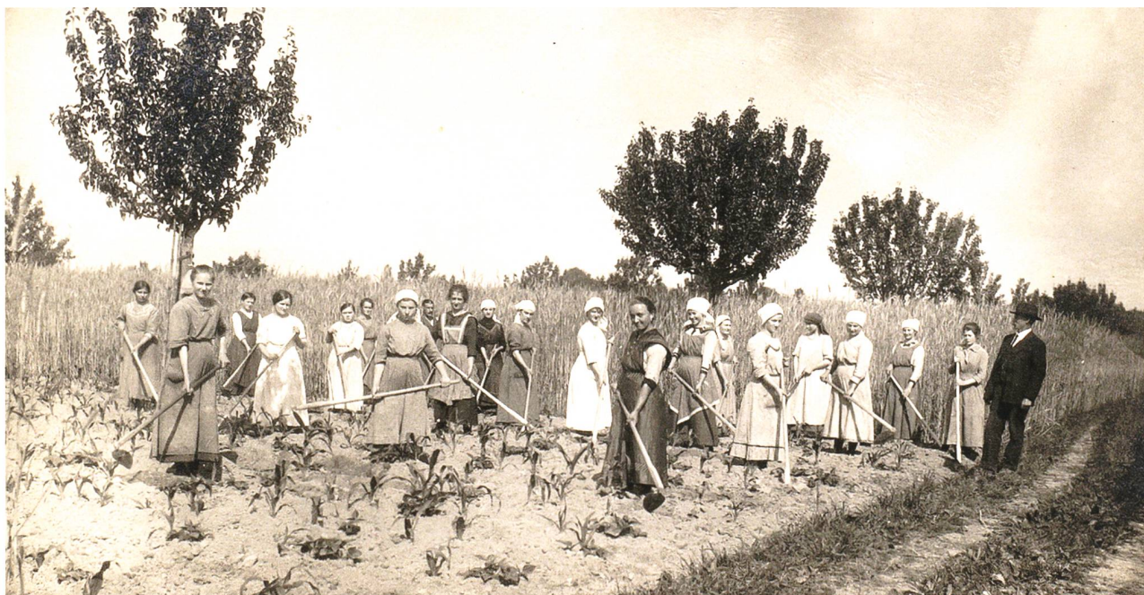
Schülerinnen der hauswirtschaftlichen Sommerschule, 1916. Auf dem Pachtland des Custerhofs in St. Margrethen gewannen die angehenden Bäuerinnen neues Ackerland. (StaatsASG, ZMB 2114).

Versorgung mit Lebens-, Futter-, Düngemitteln und Saatgut sicherzustellen und den Mehranbau zu organisieren. 54 Diese starke Einbindung führte dazu, dass die Exponenten dieser Organisationen von der Basis vermehrt als unliebsame Behördenvertreter wahrgenommen wurden. 55