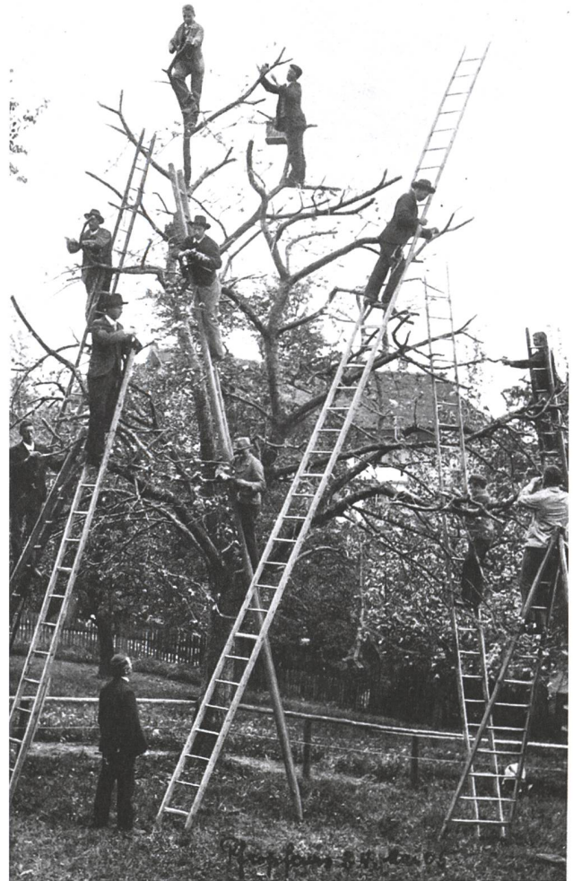
Pfropfkurs an der landwirtschaftlichen Schule Custerhof in Rheineck, 1905. Nach schlechten Vorkriegsjahren kletterten die Preise landwirtschaftlicher Produkte während des Kriegs in die Höhe..

Das St. Galler Tagblatt und Die Ostschweiz hielten anfangs 1918 dieselbe Beobachtung fest. Der Zug der Zeit dränge «die wirtschaftlichen Interessen im öffentlichen Leben viel mehr in den Vordergrund», schrieb Die Ostschweiz . 2 Jeder einigermaßen aufmerksame Beobachter könne gegenwärtig «ein besonders starkes Hervortreten der wirtschaftlichen Interessen» konstatieren, so das Tagblatt . 3 Tatsächlich gilt der Erste Weltkrieg als Katalysator für eine Entwicklung, welche als «Verwirtschaftlichung der Politik» 4 beschrieben wird. Sozioökonomische Fragen dominierten mehr und mehr, Wirtschaftsverbände gewannen an Einfluss und die politischen Gräben zwischen den ökonomischen Interessengruppen vertieften sich. 5 Die wirtschaftlichen Auswirkungen des Kriegs beschleunigten diese Tendenzen. Arbeiter und Angestellte waren die grossen Kriegsverlierer. In der Stadt St. Gallen stieg der Kon-