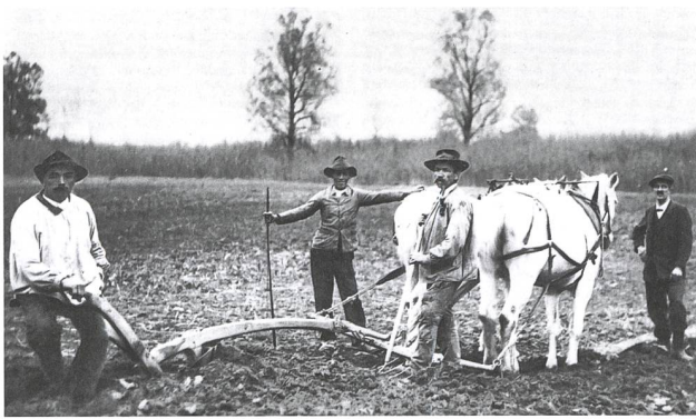
Bauern mit einem einfachen Pflug in Sevelen, 1917. Nicht nur zwischen Bauern und Bürgerlichen kam es während des Kriegs zu Spannungen, auch zwischen bäuerlicher Basis und Bauernführern begann es zu brodeln. (Kantonsbibliothek Vadiana St. Gallen, VS Q 293/1).

Arbeiter seien von «Missgunst» 44 geleet und zielten darauf, den Bauern «ihr ohnehin hartes Los noch zu verbittern» 45 . Wer angemessene Preise bekämpfe, habe kein Interesse an Produktionssteigerungen. Auch seien die Städter das Sparen nicht gewohnt. Die Sozialdemokraten – «Anarchosozialisten» 46 und «waterlandslose Gesellen» 47 – zielten bloss darauf, den Bauernstand zu schwächen, da dieser eine starke Stütze des Staates sei. Für die meisten Autoren des St. Galler Bauer bestand kein Zweifel, dass die Sozialdemokratie die Revolution plante. 48