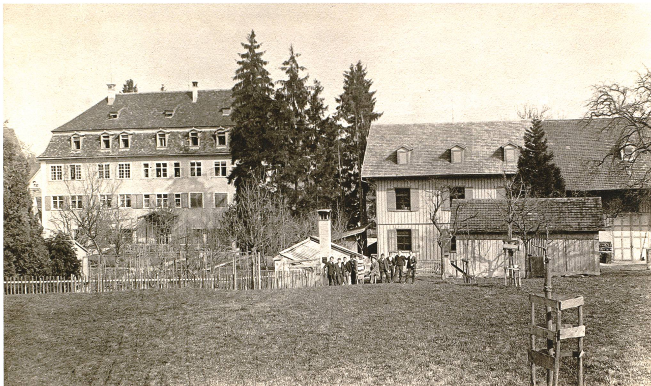
Landwirtschaftliche Schule Custerhof in Rheineck, 1907. Am Custerhof liefen viele Fäden der St. Galler Bauernpolitik zusammen.

dann wird die inländische Lebensmittelproduktion in richtiger Bedeutung erscheinen. 23