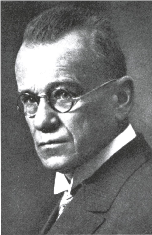
Emil Mäder (1875–1936), erster Präsident der Bauernpolitischen Vereinigung und Regierungsrat der Konservativen Volkspartei. Konservative Bauernvertreter, darunter Mäder, opponierten gegen die Gründung einer Bauernpartei und gegen das freisinnige Übergewicht innerhalb führender bäuerlicher Kreise. (Kantonsbibliothek Vadiana St. Gallen, VSS Q 123/1973).

Bauernvertreter scheinen von der Idee einer bauernpolitischen Organisation unter Führung der LG begeistert gewesen zu sein. Ein Einsender schrieb im St. Galler Bauer von «Differenzen» und «Antipathien». 103 Erst Ende Dezember 1918 104 – bereits nach Kriegsende – und erneut im März 1919 tagte eine Konferenz von Vertrauensmännern der grossen kantonalen landwirtschaftlichen Organisationen, der Bezirke und des landwirtschaftlichen Clubs in St. Gallen. Nun traten Konflikte zwischen Freisinnigen und Konservativen offen zutage. Schneider plädierte für eine organisatorische Verbindung von LG und bauernpolitischer Kommission. Nach wie vor schloss er ein selbständiges wahlpolitisches Vorgehen der Bauern nicht aus. Die konservativen Delegierten – der Sarganser Bauernvertreter Ackermann und die konservativen Grossräte Emil Mäder und Jakob Steiner – waren jedoch nicht mehr bereit, organisatorische Entscheide diskussionslos den führenden freisinnigen LG-Leuten zu überlassen. Sie for-