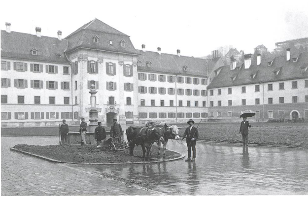
Kartoffelacker im Klosterhof St. Gallen, 1918. Der Kanton St. Gallen verdoppelte von 1917 bis 1919 in einer Anbauschlacht «avant la lettre» seine Ackerfläche.