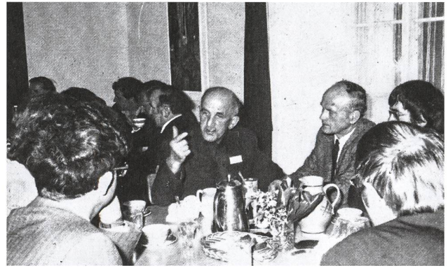
Diskussionen im Speisesaal des Tagungszentrums Schloss Wartensee in den 1960er-Jahren.

der Schöpfung (ab 1986 so benannt), 2. Arbeit mit Schicksalsgruppen und Familien, 3. Spiritualität und Persönlichkeitsentwicklung. Die Wochenendtagungen und Seminare wurden jeweils zusammen mit externen Interessierten vorbereitet und durchgeführt. Ziel war es, gesellschaftliche Fragestellungen frühzeitig aufzugreifen und alternative Lösungen zu diskutieren und bekannt zu machen, Gleichgesinnte zu stärken, den Dialog mit Andersdenkenden zu fördern und Basisgruppen zu vernetzen. 4