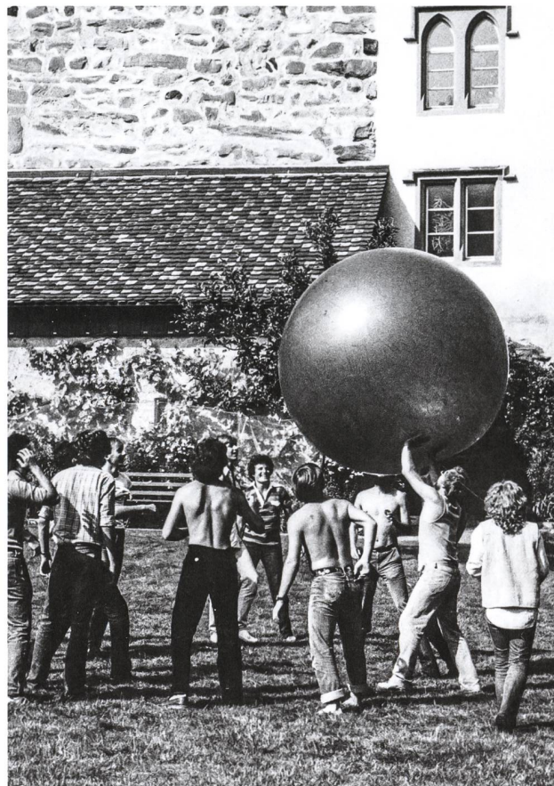
Kooperationsspiele mit Jugendlichen. Wartensee-Tag 1982.

hinderte in verschiedenen Kirchgemeinden. Beliebte waren die Wochenenden für Witwen (daraus entstanden Selbsthilfegruppen), für Geschiedene und Alleinerziehende, aber auch die Wochen für ältere Menschen. Es folgten die gut besuchten Familienwochen im Sommer und (während der Betriebsferien) die Weihnachtstage in der Grossfamilie mit bis zu 80 Teilnehmenden. Mit Kindern, Eltern und Lehrpersonen wurden auch einige Veranstaltungen zum Thema Schule gestaltet, z. B. «Den Kindern das Wort geben» oder zur Zusammenarbeit von Eltern und Lehrern.