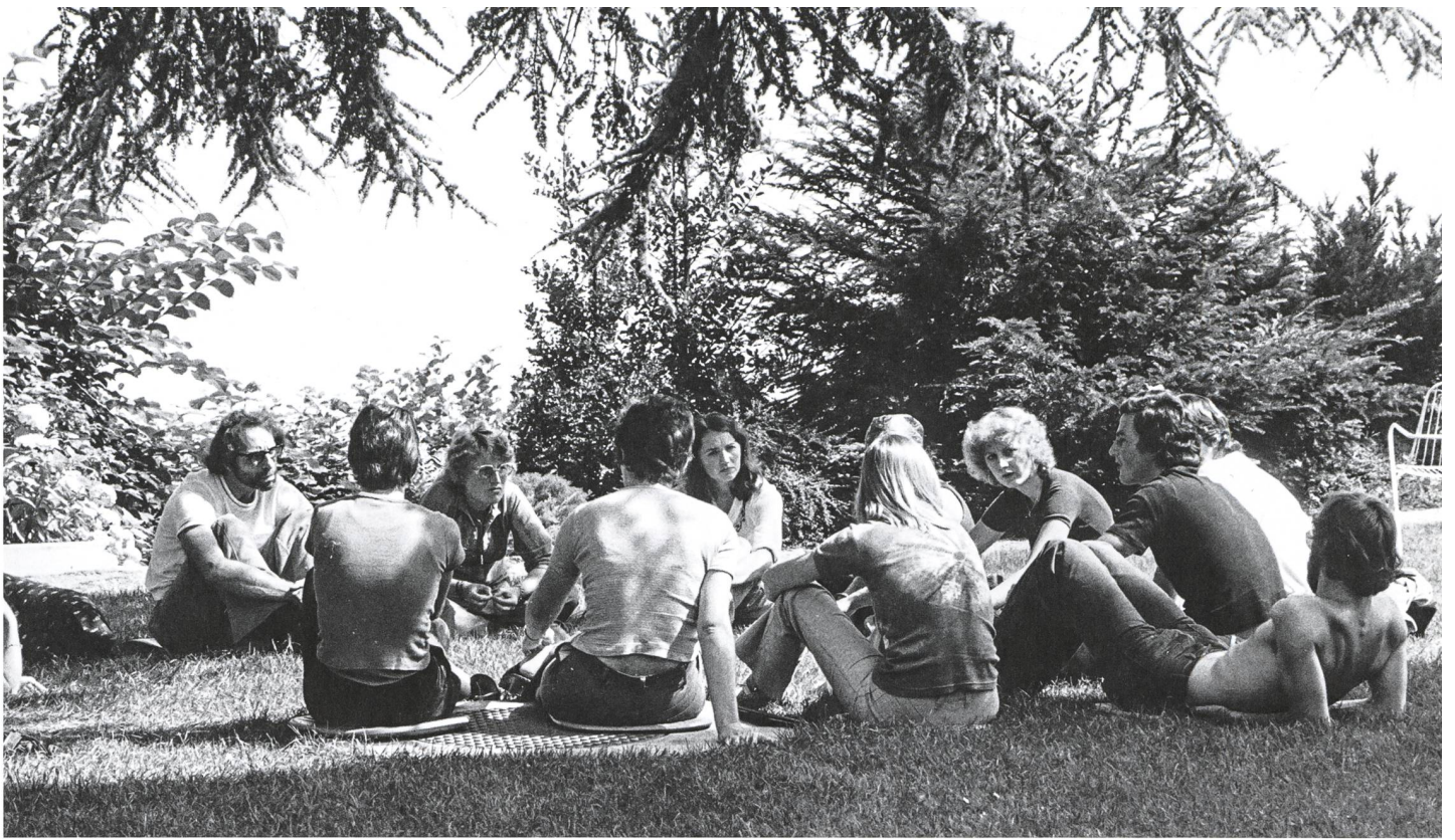
Eine Kursgruppe der Schweizer Jugendakademie auf Schloss Wartensee, 1972.