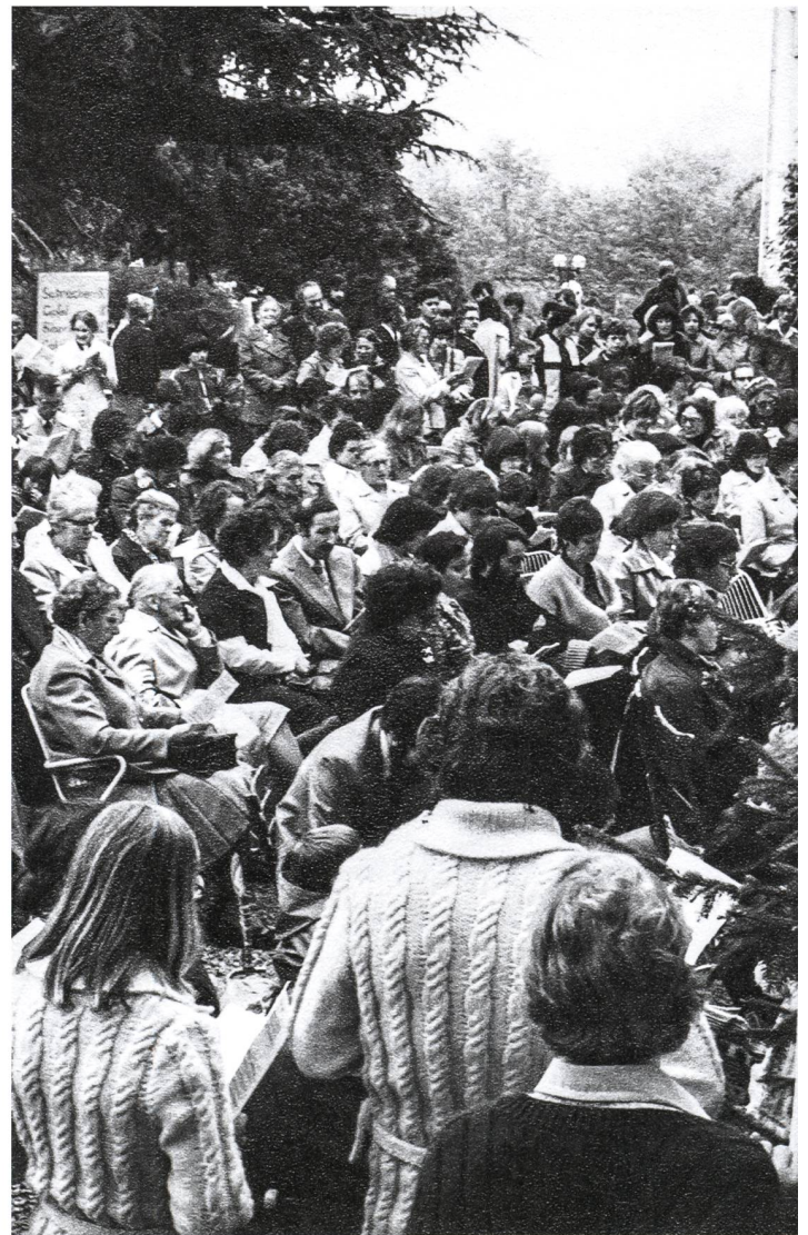
Jahresversammlung des Vereins am Wartensee-Tag im Schlosshof in den 1970er-Jahren.

Einige Beispiele von Tagungen: 1976 wurde die Mitbestimmungsinitiative der Gewerkschaften zur Diskussion gestellt, im folgenden Jahr, nach dem Chiasso-Skandal, das Bankgeheimnis der Schweiz, mit Nationalbankpräsident Leo Schürmann und Ruedi Strahm als Referenten. Während einiger Jahre suchte Wartensee zusammen mit Fremdarbeitern und mit der zweiten Generation von Einwanderern nach Wegen zu deren besserer Integration. Bestbesuchte Anlässe waren lange Zeit Drittwelt-Wochenenden, z. B. mit kritischen Fragen zur Grünen Revolution. Eine hochkarätige Arbeitsgruppe entwarf 1976–1978 in Wartensee einen Verhaltenskodex für Privatinvestoren in Entwicklungsländern. 5 Nach einer Tagung mit