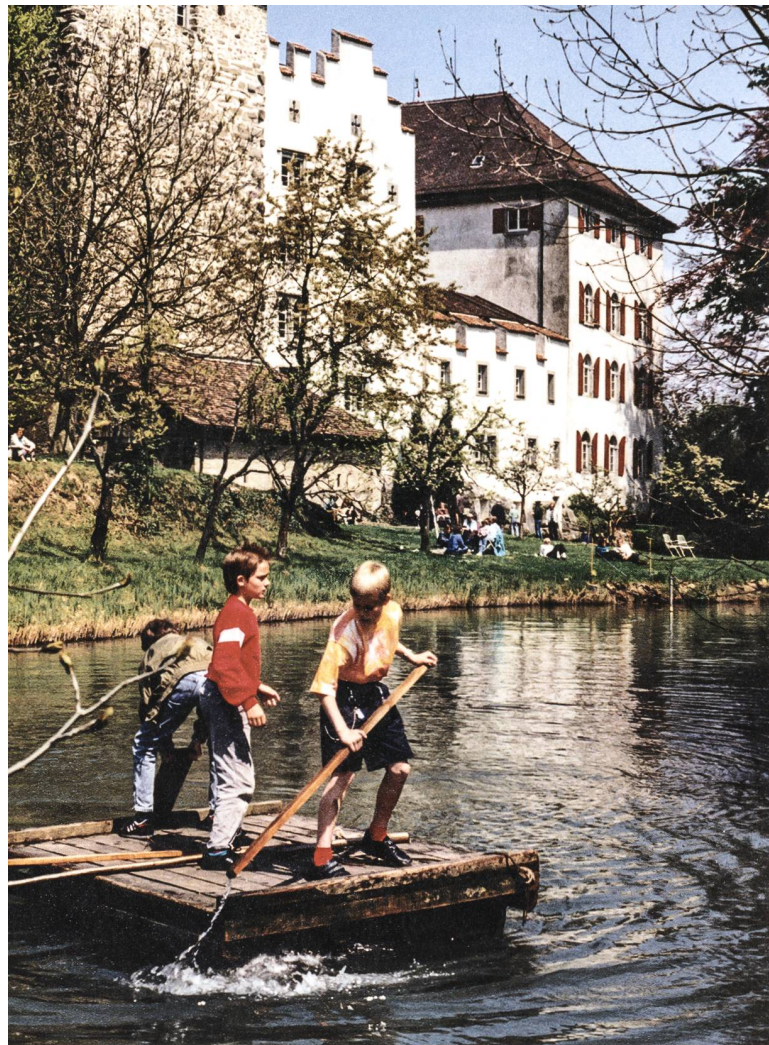
Familienwoche auf Schloss Wartensee, ohne Jahr.