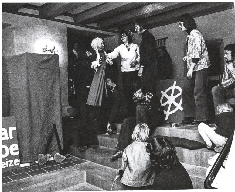
Probe für ein Strassentheater zur «Mitbestimmungsinitiative» der Gewerkschaften. Kurs der Schweizer Jugendakademie, Schloss Wartensee, 1976.

Nun war erneut «Feuer im Dach». An einer ausserordentlichen Vorstandssitzung stritt man sich darüber, ob die Teilnehmenden einer Tagung, wie geschehen, öffentlich Stellung nehmen dürfen, oder ob Wartensee sich in politischen Fragen strikt neutral zu verhalten habe. «Nicht der Verlauf einer Tagung, sondern was nach ihr folgt, macht Stunk», so ein Vorstandsmitglied. Der St. Galler Kirchenratspräsident und der Vereinspräsident erwarteten von den Beauftragten einer Volkskirche politische Unabhängigkeit und Neutralität. Die beiden Vertreter des Appenzeller Kirchenrates hingegen stärkten dem Team