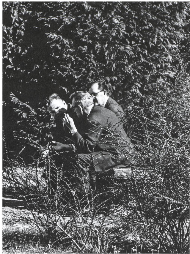
Wichtig an Tagungen sind auch Begegnungen und Gespräche in den Pausen. Wartensee, 1979.