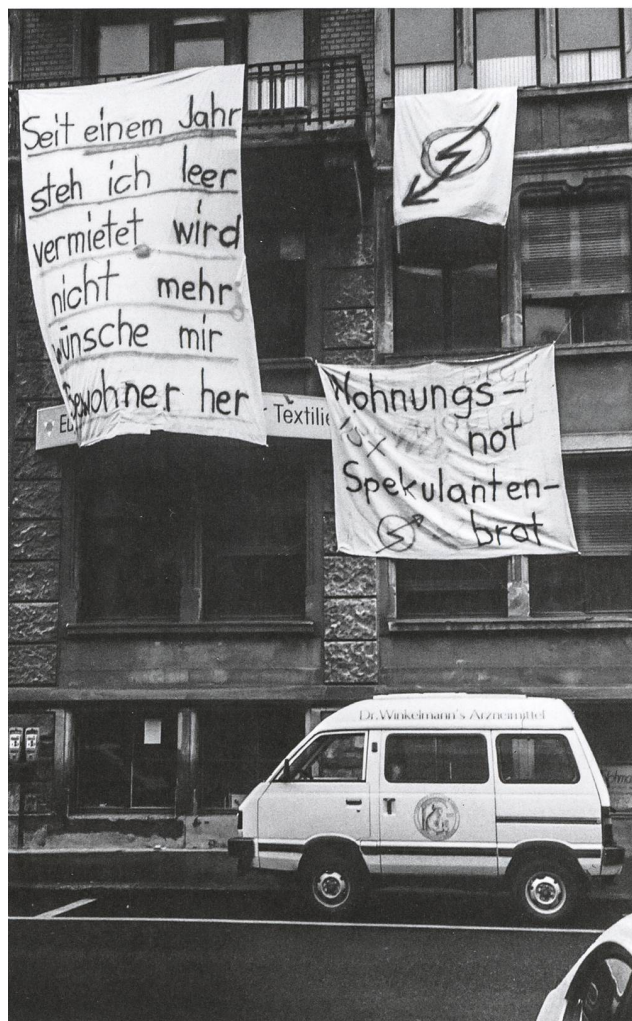
Hausbesetzung an der Davidstrasse in St. Gallen, 1987.