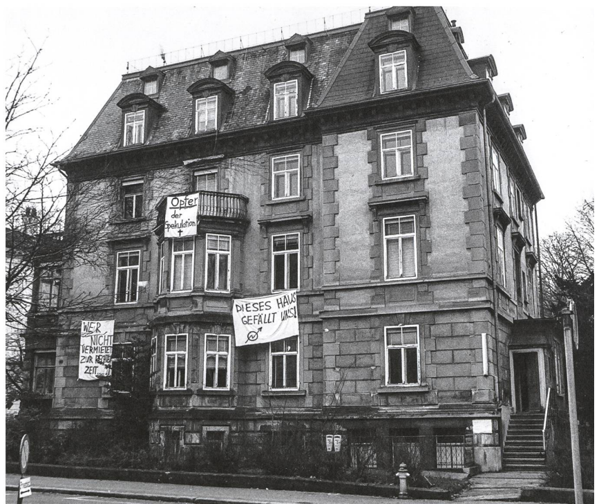
Hausbesetzung an der Scheffelstrasse in St. Gallen, 1987.