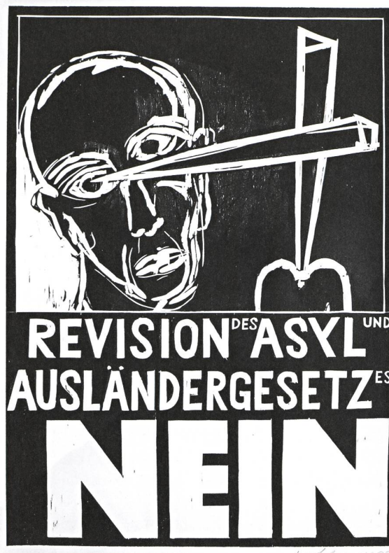
Diese Gesetzesrevision geht ins Auge. Künstlerplakat von Josef Felix Müller, 1987.