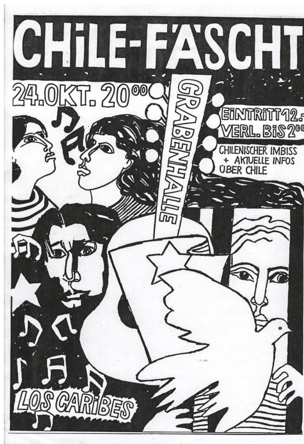
Aufruf zum Chile-Fest in der St. Galler Grabenhalle. Flugblatt des Asylkomitees, 1987.