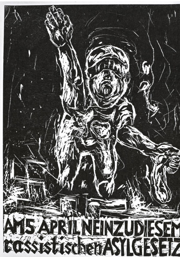
Künstlerplakat von Peter Kamm, 1987.