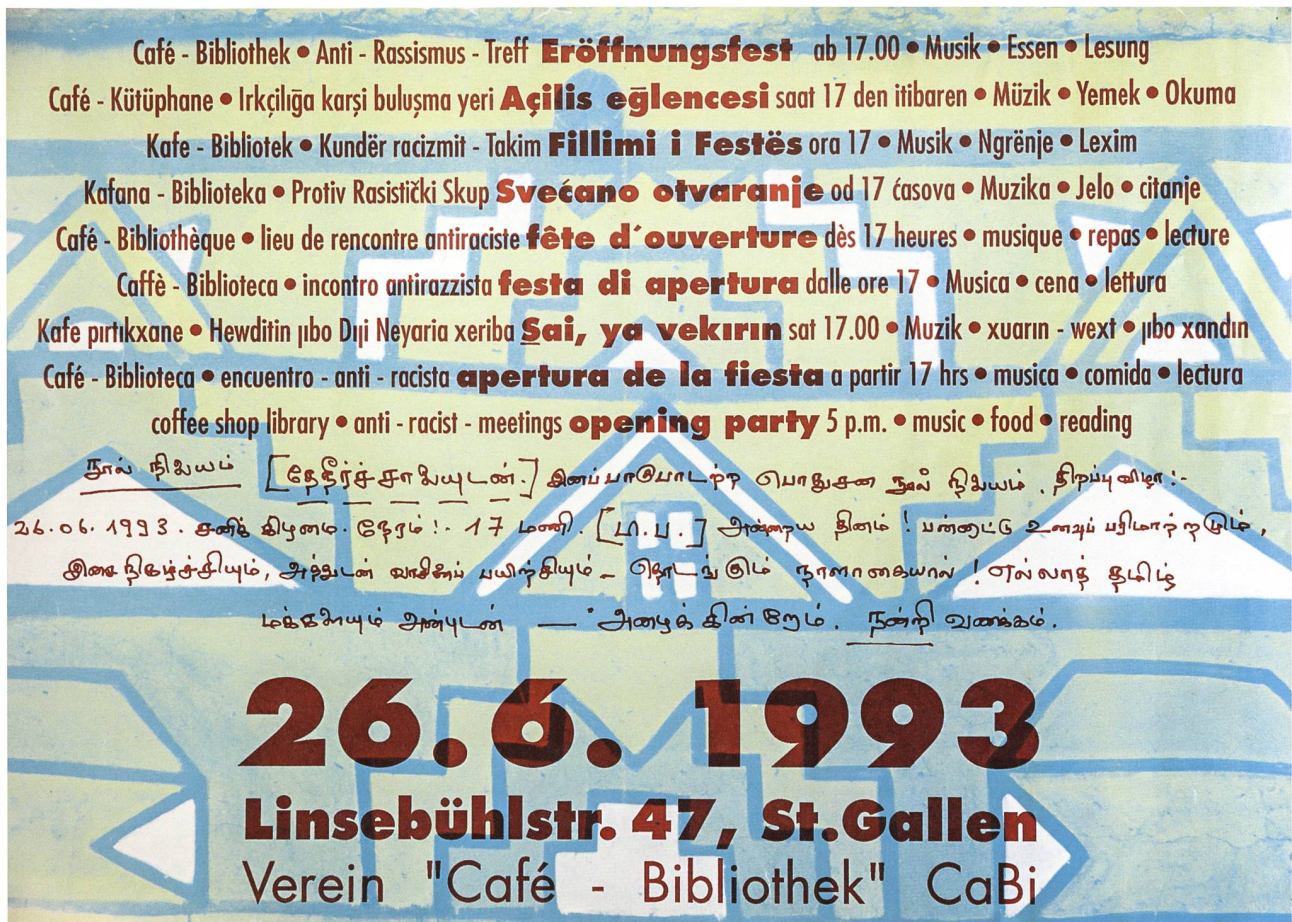
Eröffnungsfest des CaBi (Café-Bibliothek) Antirassismus-Treffpunkts am 26. Juni 1993.