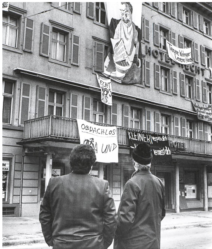
Das besetzte Hotel Hecht über die Jahreswende 1988/1989, St. Gallen.

blatt. Darauf folgte eine Liste, wer alles in der Stadt ein Bedürfnis nach mehr Raum hatte: «Flüchtlinge hausen in Luftschutzbunkern ohne Tageslicht. GassenköchInnen kochen in ausrangierten Bauwagen. FixerInnen haben noch immer keinen Raum. Musikgruppen üben in miesen teuren Kellern. Theatergruppen, KünstlerInnen sind auf der Jagd nach Proberäumen. Politisch arbeitende Gruppen treten sich in engen Zimmern auf die Füsse. Werkstätten müssen in Privaträumen geführt werden.»