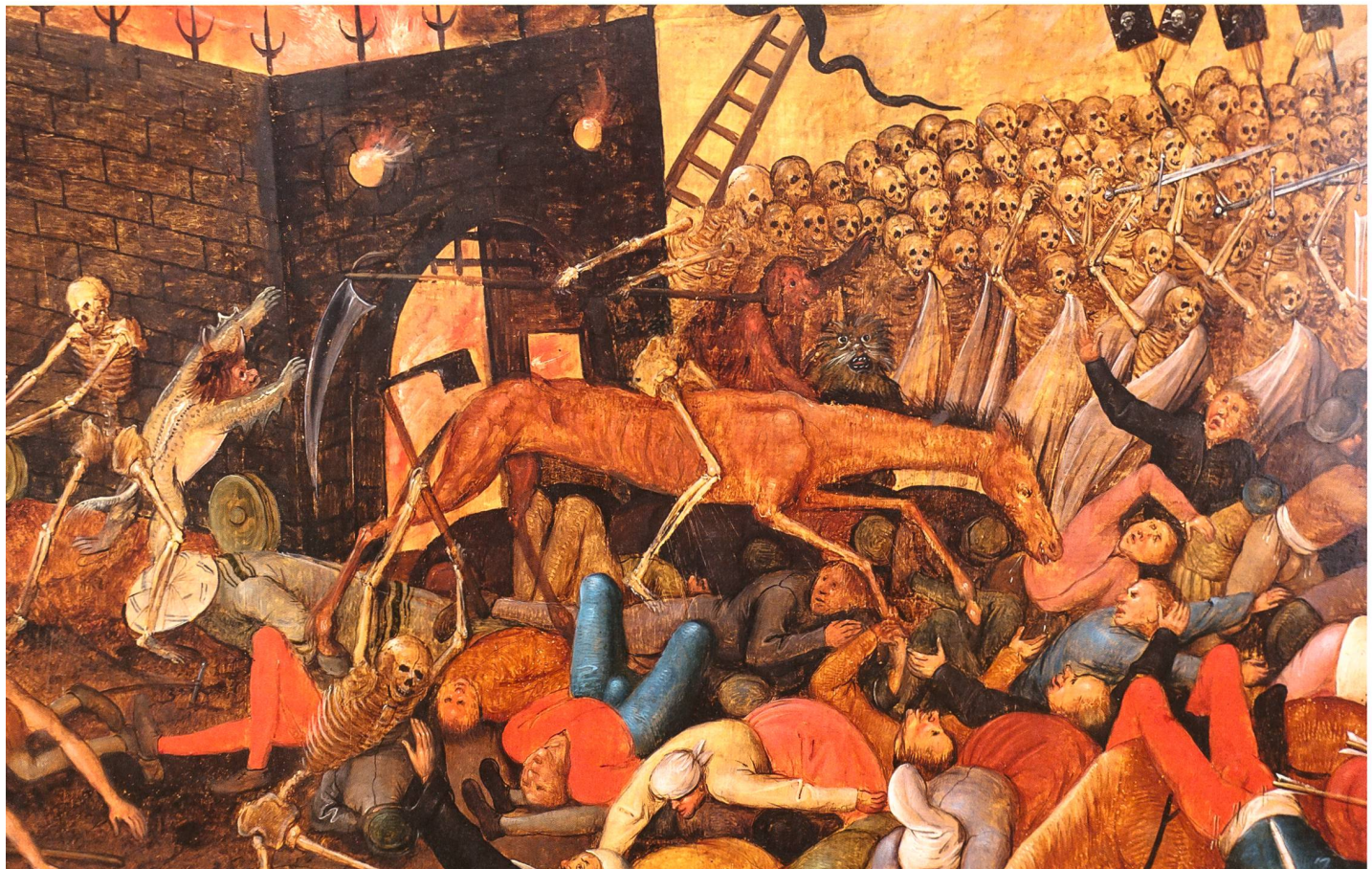
Triumph des Todes (Ausschnitt). Das grosse Sterben in apokalyptischer Dimension. Das Gerippe als Reiter auf einem todtgezeichneten Pferd schwingt die Hippe wahllos über den Köpfen von fliehenden Menschen und treibt diese vor sich her. Der Feuerwagen spielt einerseits an auf die Verbrennung der Leichen, andererseits auf die purgierenden Feuer, die zur Reinigung der Luft entfacht wurden und in denen man die Kleider verbrannte. Pieter Bruegel d. J. (1564/1565–1637/1638), Kopie nach Pieter Bruegel d. Ä. (um 1526/1530–1569), 1608 (?). Öl auf Eichenholz, 123.3 x 166.5 cm. Quelle: Basel, Kunstmuseum. Schenkung von Hans-Rudolf Hagemann 1995, Inv. G 1995.29. Aufnahme 2017, Johannes Huber, St. Gallen.

halb dieses scheinbaren Fahrplans flackerte sie landauf, landab spontan auf, was unter den Menschen eine grosse Verunsicherung verursachte. Kein früheres Beispiel eines Pestzugs ist besser dokumentiert als dieses – und das wohl vor allem wegen der am Ende des Mittelalters im Zusammenhang mit dem Humanismus und der aufkeimenden Reformation stark ausgeprägten chronikalischen Schreibkultur. Für die Stadtorte der Ostschweiz brachte die Pest