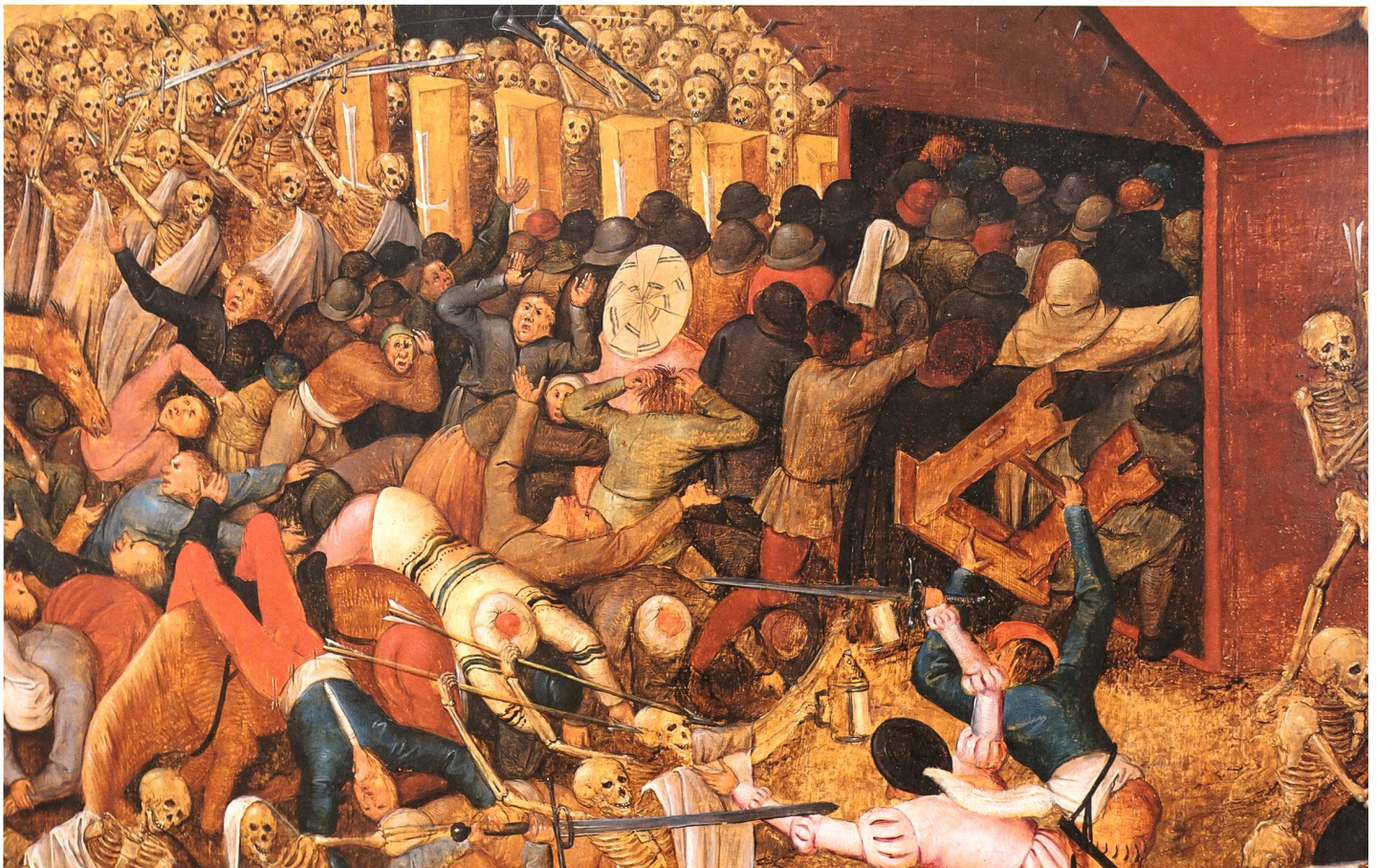
Triumph des Todes (Ausschnitt). Von Panik ergriffene Menschenmassen fliehen vor dem Todesreiter (der Pest) in ein kistenförmiges Gehäuse, das sich als Falle mit stachelbewehrter Klappe herausstellt. Die Überlebensreflexe der Menschen erwiesen sich in vielen Fällen als brüchige Illusion. Im Vordergrund rechts Angehörige einer Tischgesellschaft, die von Gerippen angegriffen werden. Werkhinweise in der ersten Bildlegende dieses Themenfensters. Quelle: Basel, Kunstmuseum. Schenkung von Hans-Rudolf Hagemann 1995, Inv. G 1995.29. Aufnahme 2017, Johannes Huber, St. Gallen.

Wie es zu jener Zeit verbreitet auch das aleatorische Motiv des Totentanzes eindrücklich vor aller Augen führte: Der Tod machte vor niemandem Halt. Anfang Juni hielten sich «etlich henker» aus Konstanz beim Henker in St. Gallen auf. Offensichtlich waren sie aus der Bodensee-stadt vor der Seuche («uß dem tod») geflohen. Sodann starb in St. Gallen als eine der ersten gerade die Frau des