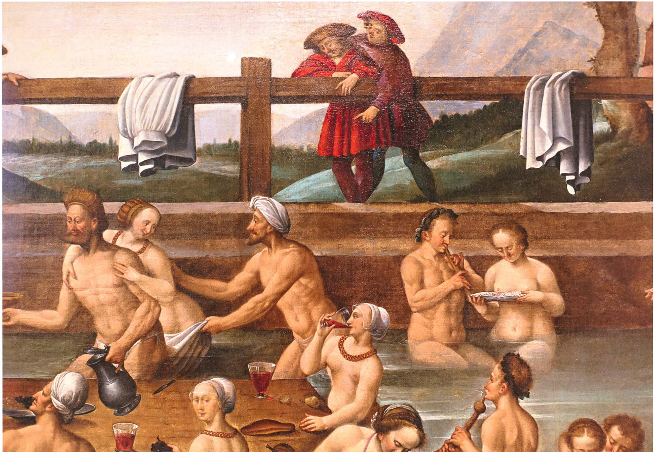
Fruivolität und lüsterne Ausgelassenheit, auch als Reaktion auf das grosse Sterben. Männer und Frauen amüsieren sich in einem Wildbad (Thermalquelle), angeblich jenem von Leuk VS. Vielmehr handelt es sich um eine zeitlose Darstellung, die eine seit Giovanni Boccaccio eingewurzelte Vorstellung wiedergibt: Auf das Grauen der Pest wird, zum Lebenserhalt, antithetisch mit der schillerndsten Blüte der Lust und ungehemmter Sexualität geantwortet. Hans Bock d. Ä. (um 1550/1552–1624), 1597. Öl auf Leinwand, 78.4 x 109.6 cm. Quelle: Basel, Kunstmuseum. Ankauf mit Mitteln des Birmann-Fonds 1872, Inv. 87. Aufnahme 2017, Johannes Huber, St. Gallen.

Kunststücke forderten, legt die aufgebrochene Kritik und Distanz an der/zur Bilderverehrung offen. Spätestens an diesem Punkt war aus reformatorischer Sicht die blinde Mechanik der Heiligenverehrung beendet. Gerade Zwingli (Lied, Gebet) und Vadians (Pestkonzilium) Versuche einer Verarbeitung der Ereignisse von 1519 zeigen, so unterschiedlich sie auch sein mögen, von Hoffnung und Verantwortung geprägte persönliche Formen des Zugangs zum Glauben.