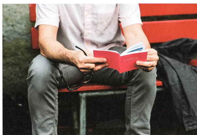
Fotobüchlein 2019.

Allen Beteiligten, insbesondere dem Büro Sequenz und den Verantwortlichen des Museums, danken wir herzlich für die Unterstützung und das Gastrecht.