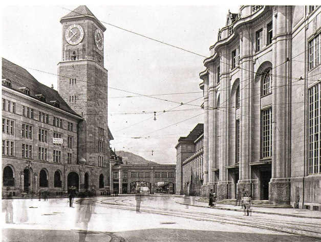
Bahnhofplatz St. Gallen: Postturm als Gelenk. Foto Marburg um 1920, Archiv Kantonale Denkmalpflege.