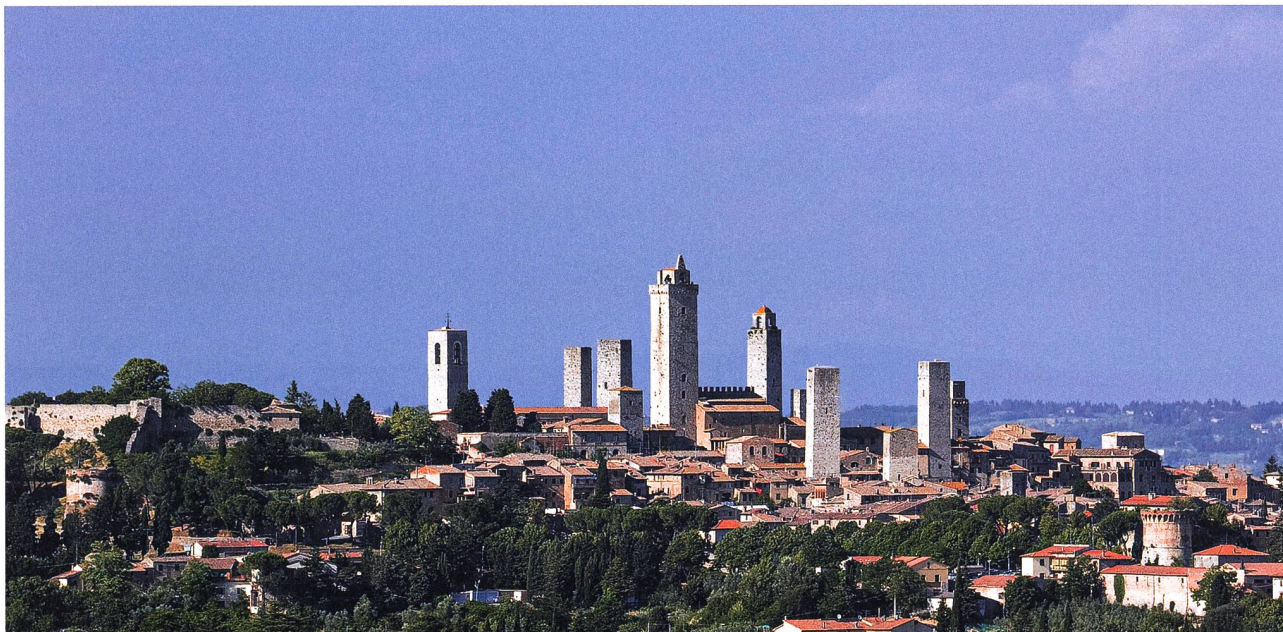
San Gimignano, Italien: horizontbildende Machtsymbole.

Auch heute sind Wohn- und Gewerbebauten mit einem vergleichsweise geringen Fussabdruck und einer zweistelligen Stockwerkzahl im Grunde unsinnig. Zur ökonomischen Fragwürdigkeit (Erschliessung, Statik) gesellen sich räumlich/städtebauliche und auch physiognomische Schwierigkeiten. Zwar wird das vertikale Bauen immer wieder als sinnvolle Massnahme des Verdichtungsbedarfes in unseren Siedlungsräumen bezeichnet. Einer seriösen fachlichen Betrachtung kann diese Bauform aber kaum standhalten. Eine markante Fernwirkung und ein entsprechender Orientierungswert kann Türmen im Siedlungsgewusel freilich nicht abgesprochen werden. Weit schwerer wiegt aber die mangelhafte (Stadt-)Raumbildung von Hochhäu-