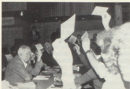
Auch an der diesjährigen Delegiertenversammlung wird über wichtige Fragen abgestimmt. – Les délégués s'intéressent aux questions qui décident de l'avenir de la société.

3.4 Mitwirkung an den Gemeinschaftskonzerten von EMV, EOV und SCV am 9. September 1989 in Brig und 1990 voraussichtlich in Delémont.