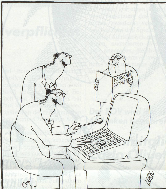
Musik in die Bibliothek – bzw. einen Computer für die Orchester. Un ordinateur au service des orchestres.

Die Initianten sind überzeugt, dass Proscript einem Bedürfnis entspricht. Es liegt nun an der Verwaltung und den Mitarbeitern, Proscript bekannt zu machen und gute Arbeit zu leisten.