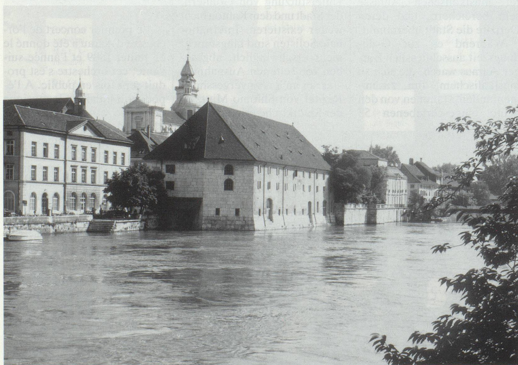
Nach der Delegiertenversammlung ist ein Ausflug auf der Aare vorgesehen. Unser Bild: Das Solothurner «Landhaus». Foto: Verkehrsverein · Après l'Assemblée, les participants feront une excursion en bateau sur l'Aare. Photo de l'Office du tourisme de Soleure.

Alles, was die EOV-Mitglieder zum Gelingen des Orchestertreffens beitragen können, ist uns willkommen. Das Organisationskomitee freut sich auf zahlreiche positive Reaktionen!