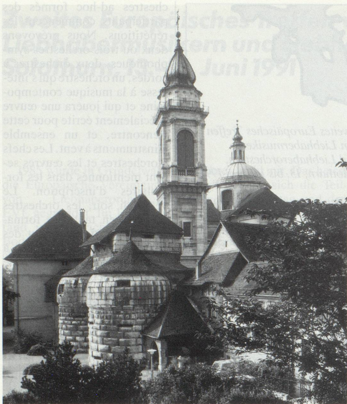
Das zweite Europäische Treffen der Liebhabermusiker findet in Solothurn statt. Unser Bild: Das Baseltor und der St. Ursenturm. · La 2e Rencontre européenne des orchestres aura lieu à Soleure. Ci-dessus: la tour de la cathédrale Saint-Urs.

cherchons, dans la région de Soleure/Wangen/Langenthal/Niederbipp, des familles qui seraient prêtes à loger un participant. Les membres de la SFO ou leurs amis qui ont la possibilité d'offrir une ou plusieurs chambres (avec petit déjeuner) sont priés de s'annoncer au secrétariat.