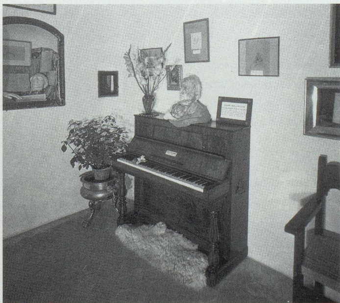
Neben dem mehrstündigen Üben blieb auch Zeit, sich auf den Inseln umzusehen. In Valldemosa gibt es zum Beispiel das Mallorcinische Klavier von Chopin.