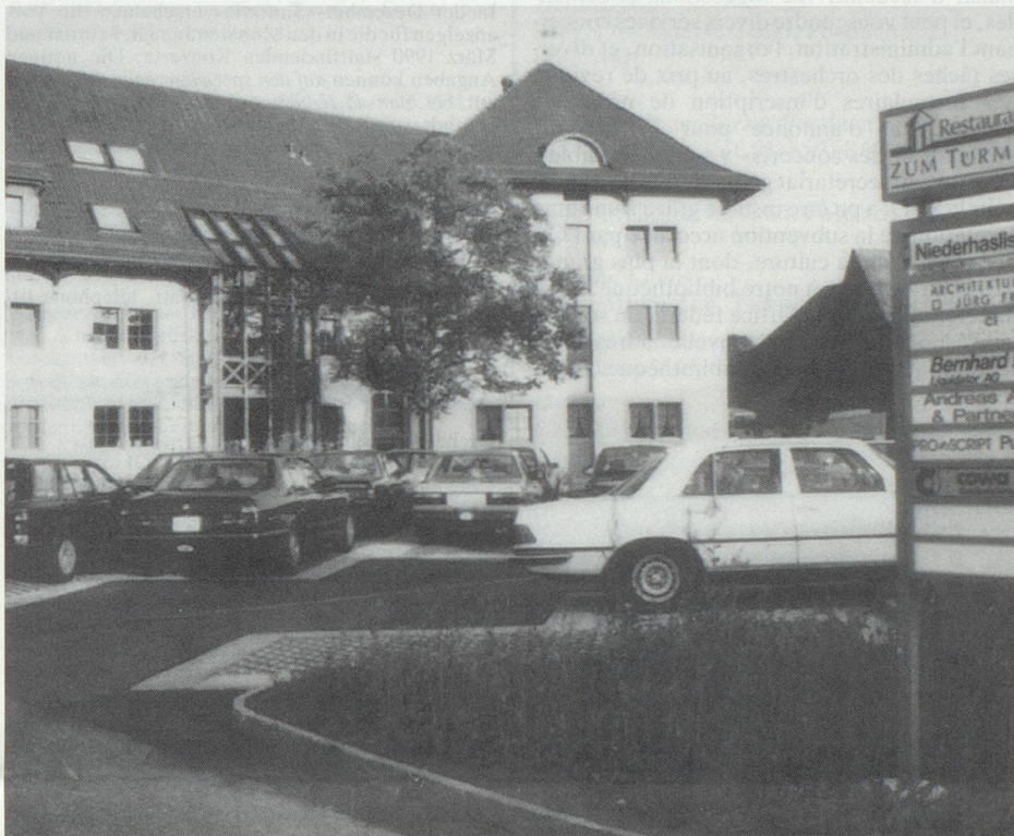
Die neu eingerichtete Geschäftsstelle des EOV befindet sich im ersten Stock des Eckhauses. Le nouveau secrétariat central de la SFO a récemment été emménagé au 1er étage de la tour.

Die Geschäftsstelle kann auch spezielle (zum Beispiel administrative, publizistische, organisatorische) Aufgaben der Orchester übernehmen, dies zu den Selbstkostenpreisen. Die Geschäftsstelle stellt gerne Formulare für An-