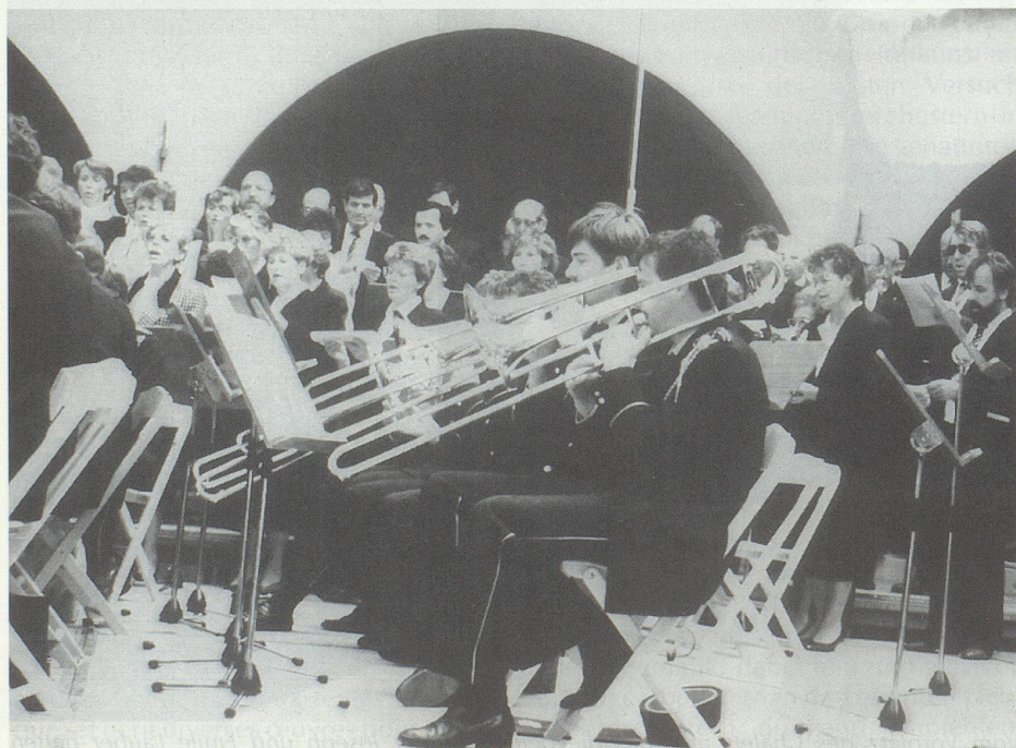
«Die Blechblasinstrumente – vor allem die Posaunen – können ganz anders verwendet werden als nur immer im Fortissimo. Bei richtiger dynamischer Dosierung klingen sie wie schöner, edler Orgelton.»