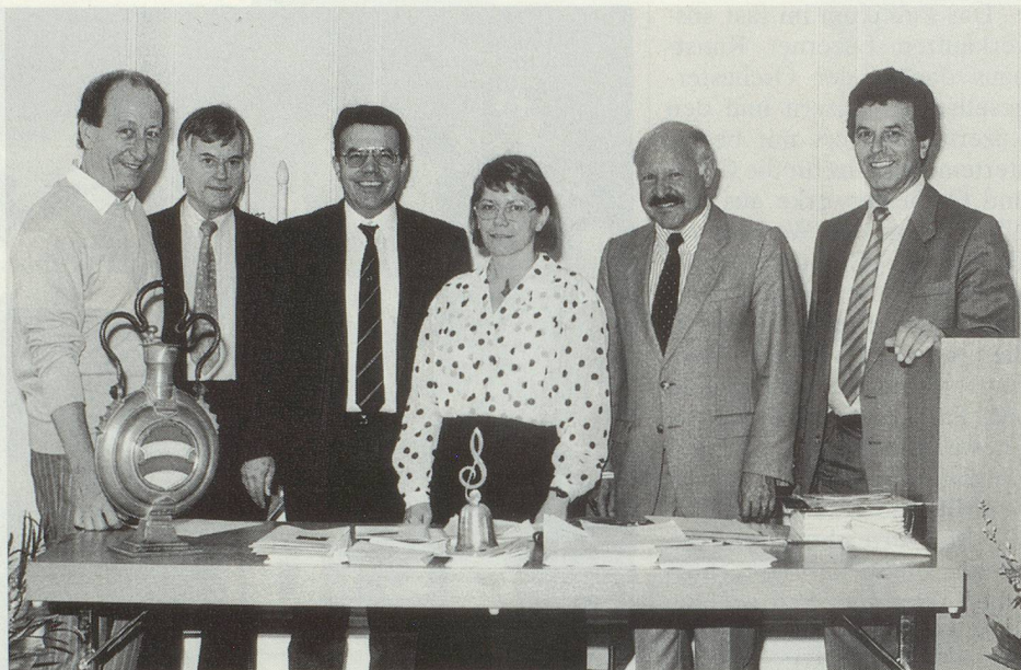
Der gesamte EOJ-Vorstand wurde in seinem Amt bestätigt. Le Comité central de la SFO a été réélu par acclamation.