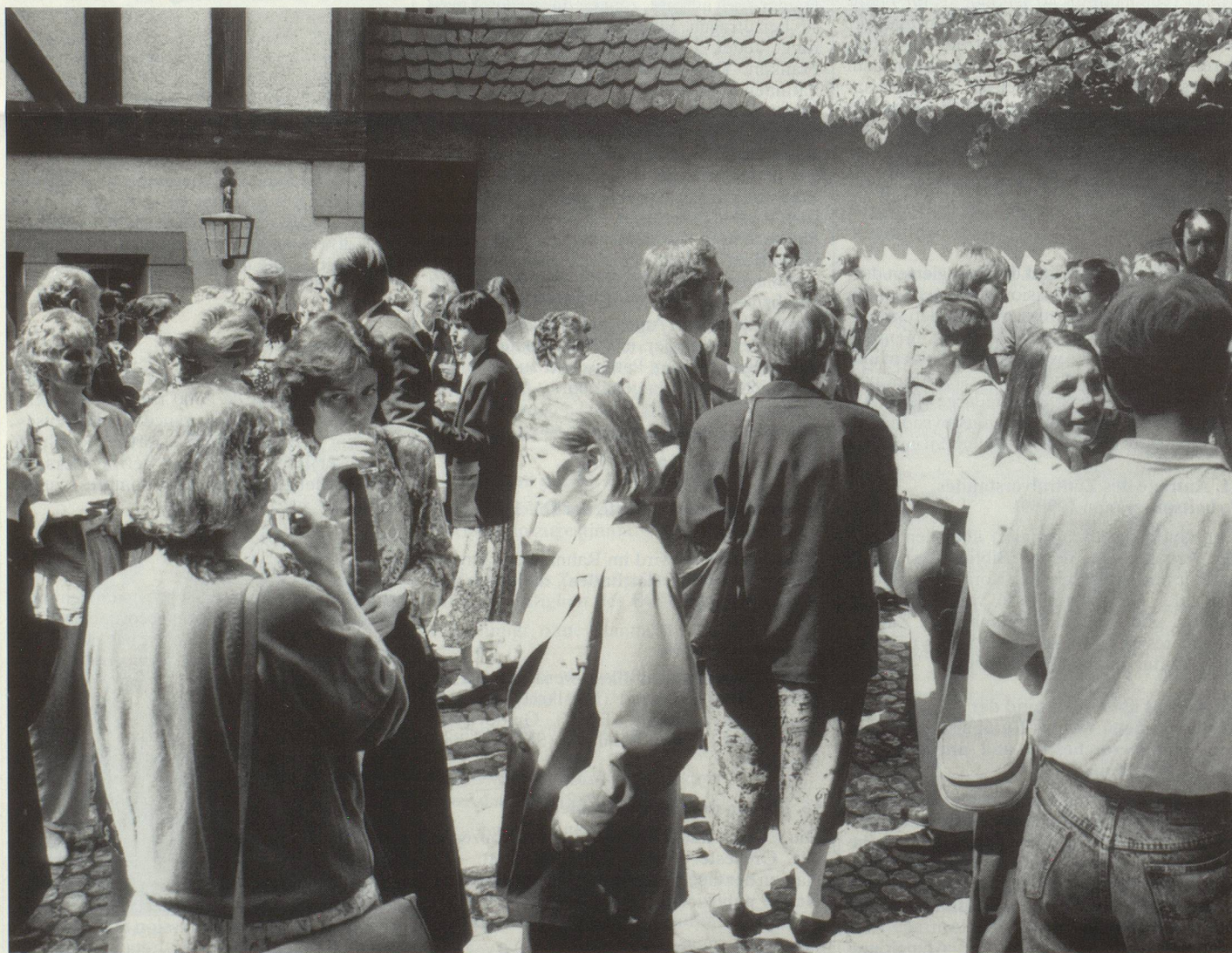
Nach der Delegiertenversammlung wurde ein Aperitif vom Stadtrat Zofingen offeriert. Merci au Conseil municipal de Zofingue qui a offert l'apéritif.

Aucune motion n'ayant été présentée par les sections, le président confirme que la prochaine Assemblée des délégués se tiendra lors de la Rencontre internationale en juin 1991 à Soleure, et à Horgen en 1992. Plusieurs invités présentent leurs félicitations et leurs bons vœux. La journée se termine par un concert de l'orchestre de Zofingue. Le noms des vétérans à l'honneur seront publiés dans la prochaine édition de Sinfonia.