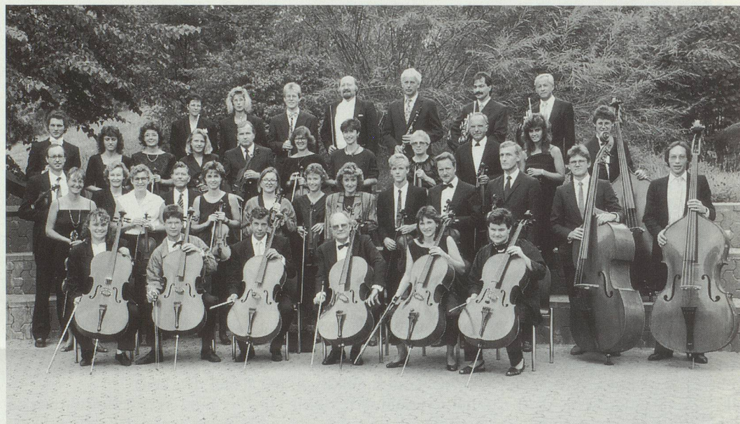
Zum Jahr des Friedens 1990 spielt der OVE «In Terra Pax» von Frank Martin.

1920 traten ein paar Musikfreunde zusammen und gründeten den Orchesterverein Gerliswil (heute Emmenbrücke). Könnten diese Pioniere das stattliche Ensemble heute sehen und hören, sie wären wohl sehr glücklich, die grossen Schwierigkeiten und Strapazen einer Vereinsgründung auf sich genommen zu haben.