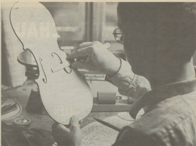
Einmessen des Bassbalkens in die fertig ausgearbeitete Geigendecke.