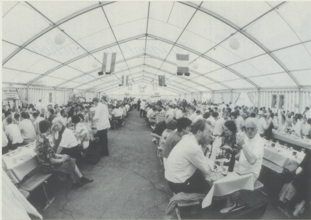
Nach den Proben, vor den Konzerten und zum Solothurner «Fest Europas» trafen sich über 1000 Teilnehmer zum gemütlichen Beisammensein.

Das war schon ein Gefühl, in so einem grossen Orchester hatte ich noch nie mitgewirkt. Die Stimmung unter den Teilnehmern entwickelte sich gut. Ich freundete mich mit einer holländischen Gruppe an, und wir trafen uns im Laufe des Treffens auch ein paarmal beim Essen. Zusehens war die erste Probe vorbei, und dass am Nachmittag die Streicher nur eine Stunde «arbeiten» mussten, war fast enttäuschend. Nach der Probe besuchte ich ein paar andere Orchester. Die Lokale waren leicht zu finden, waren doch wegen des warmen Wetters die Fenster geöffnet, so dass Mozart, Schubert und Elgar durch die Strassen von Solothurn schallten.