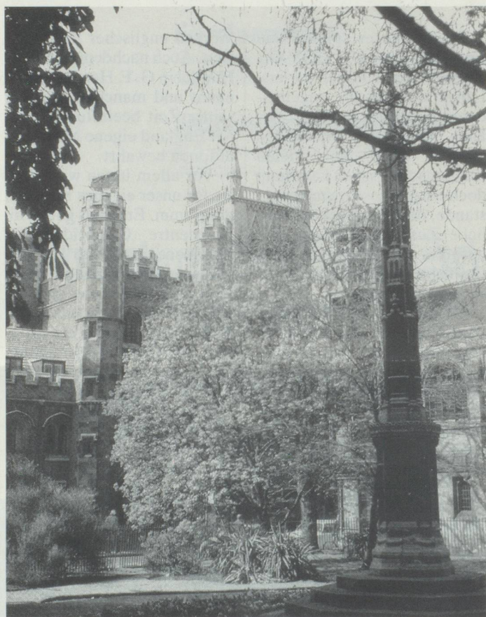
Mit seinen über zwei Dutzend malerischen Colleges aus allen Zeitaltern seit dem Mittelalter zählt Cambridge zu den sehenswertesten Städten Grossbritanniens.

DAS ERSTKLASSISCHE SCHWEIZER SATELLITENRADIO