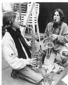
Junge Instrumentalisten – Orchestermitglieder und Konzertbesucher der Zukunft. Jeunes instrumentalistes: membres des orchestres et publique dans les concerts de demain.

L'un des concerts a eu lieu dans les salles d'un musée d'art, où les cuivres ont été priés de ne pas «forcer» pour éviter les dégâts. Les participants ont par ailleurs eu l'occasion d'assister à des répétitions au Metropolitan Opera où jouait l'Orchestre philharmonique de New York.