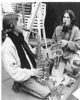
Junge Instrumentalisten – Orchestermitglieder und Konzertbesucher der Zukunft. Jeunes instrumentalistes: membres des orchestres et publique dans les concerts de demain.

L'un des concerts a eu lieu dans les salles d'un musée d'art, où les cuivres ont été priés de ne pas «forcer» pour éviter les dégâts. Les participants ont par ailleurs eu l'occasion d'assister à des répétitions au Metropolitan Opera où jouait l'Orchestre philharmonique de New York.