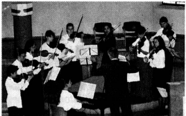
Camerata Giovanile della Svizzera Italiana in Zofingen