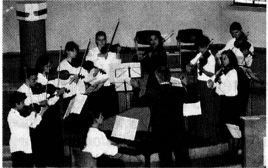
Camerata Giovanile della Svizzera Italiana in Zofingen