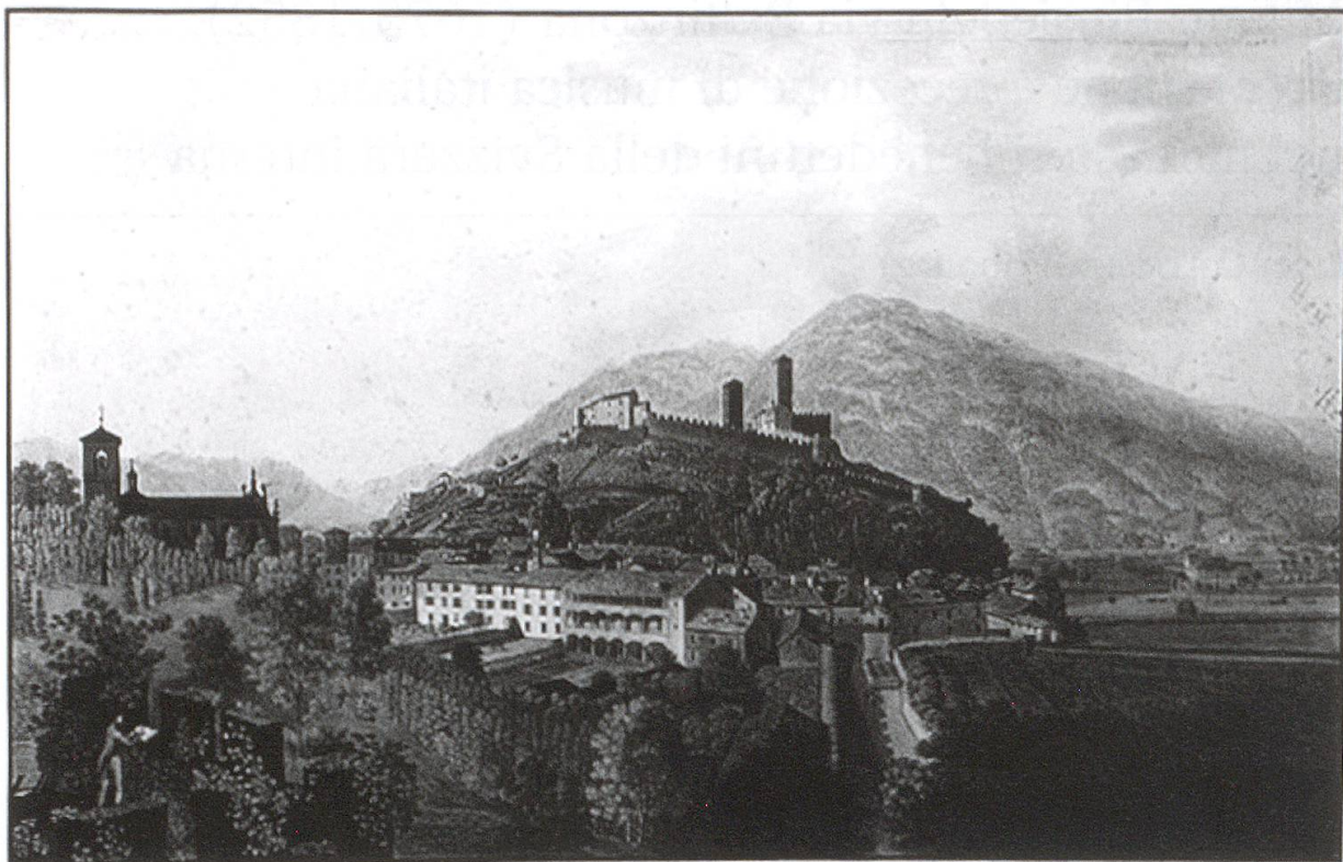
Die Abtei zu Bellinzona

Fig. 1: La residenza benedettina di Bellinzona – incisione, inizio XIX sec. (Klosterarchiv Einsiedeln).