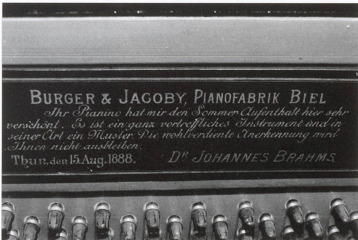
Abb. 2: Plakette, welche von der Pianofabrik Burger und Jacobi (bisweilen auch Jacoby geschrieben) in Pianinos derjenigen Serie angebracht wurde, aus welcher Brahms in Thun ein Exemplar ausgeliehen wurde.