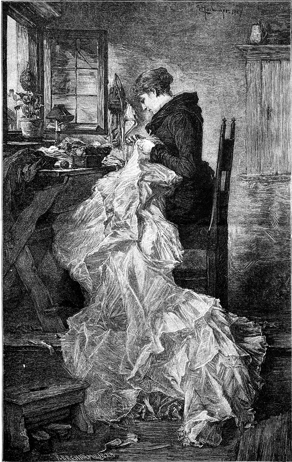
Andern am Glückskleid weben — und selber das Trauerkleid tragen . . .

Freilich, auch jetzt war nicht alle Tage Sonnenschein. Trübe Wolken verdunkelten auch dann und wann den heitern Himmel, und nicht immer waren wir fünf Geschwister ein Herz und eine Seele. Leicht war es nicht, alle zu einen; aber mit gutem Willen ging es doch. Wieder nahte Weihnachten, das Fest der Feste, wieder schmückte ich des Waldes frischgrüne Tanne mich hat, seine mich bat, seine schlichten Worte durfte ich nicht dieser Stimme folgen. Ich lehnte ab. —