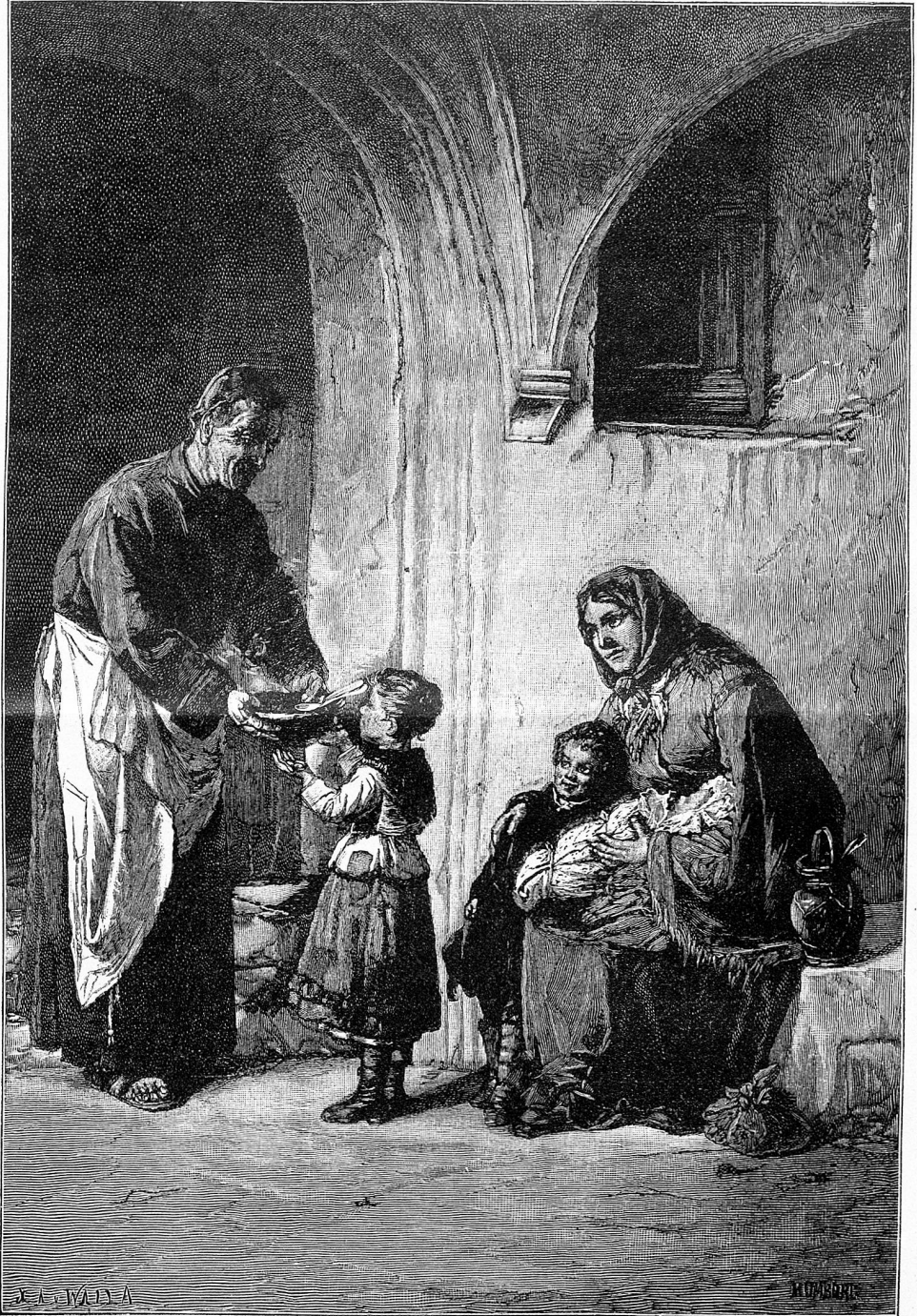
An der Klosterpforte.

des naturnotwendigen Zusammenwirkens aller Seelenkräfte eine Krankheit des Verstandes. Uebertriebene Schwärmerei und ziellose Träume erzeugen Trugbilder in Hülle. Natürlich, der Verstand wird gewaltsam geknechtet; er seufzt — oder schweigt unter der Herrschaft der Phantasie. Klar Denken, folgerichtig Schließen und Handeln ist alsdann ein Ding der Unmöglichkeit; dafür treten verschrobene und fixe Ideen auf, die selbst die