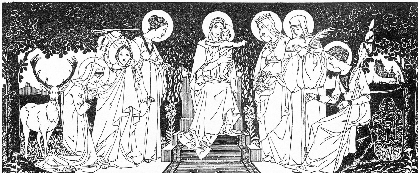
St. Jda · St. Regula · St. Verena · St. Elisabeth · St. Wilborada · St. Bertha