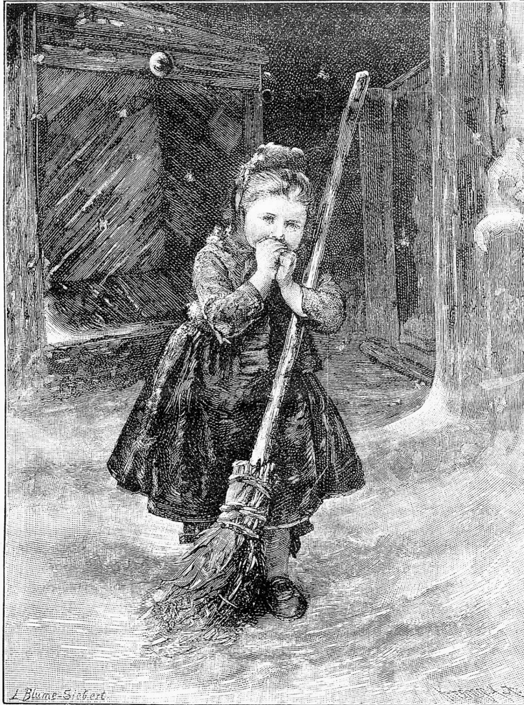
Zur kalten Winterszeit.

Kalts forschendem Blicke zeigte sich in diesem Moment ein älteres unscheinbares Service. „Wie hoch kommt das dort?“ fragte er.