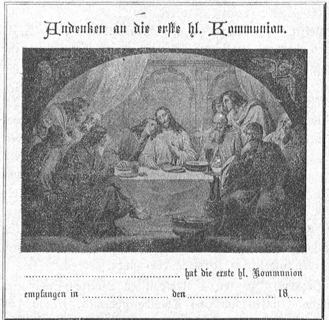
Verkleinerte typographische Abbildung von Nr. 13549.

ist die gleichfalls polychrome Einfassung im Renaissancestil mit Goldgrund. Ihre vier Ecken zeigen die Bilder der vier hl. Evangelisten, die zwei Hochheiligen in der Mitte wehrauchschwingende Engel, die obere Querleiste den Kelch mit der heiligen Hostie und die untere Querleiste die Figuren von Glaube, Hoffnung und Liebe. Die ornamentale Füllung bilden kunstreiche Gebilde aus Laub- und Blumengewinden, aus Aehrenbündeln und Traubenbündeln. Das Ganze macht einen höchst kunstreichen und vornehmen Eindruck, geeignet die Weihe des Tages der ersten hl. Kommunion würdigh darzustellen und dauernd im Gedächtniß des Besitzers festzuhalten.