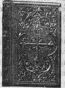
Einband No. 401.

Wer sich über den Ursprung, Ausbreitung, Vortrefflichkeit und Früchte der Herz-Jesu-Andachten sicher und rasch unterrichten oder orientieren will, der greife zu diesem nach Inhalt, Einrichtung und Ausstattung gleich vorzüglichen Buche. Wir finden an ihm nichts auszuweisen. Spaidingen, „Magazin für Pädagogik“.