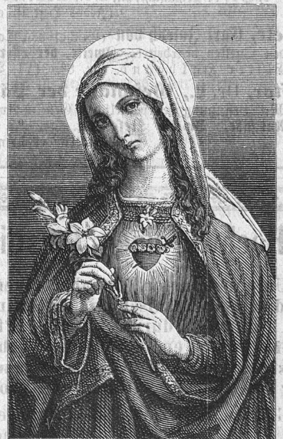
Das hl. Herz Mariä.

Größte Auswahl in religiösen Bildern in Farbendruck und Stahlstich, mit u. ohne Spiken.