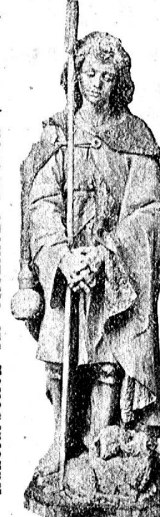
Kunstarbeiten für öffentliche Kirchen (zoll frei)

Schöner illustrierter Preis-Katalog gratis und franko.