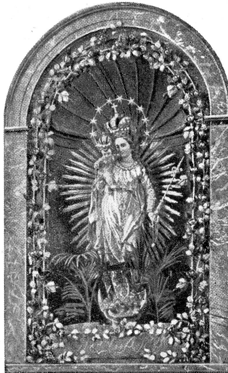
ALTARKRÄNZE, KIRCHENLEUCHTER, WEIHWASSERKESSEL, TABERNAKELTÜREN in einfacher und reicher Ausführung