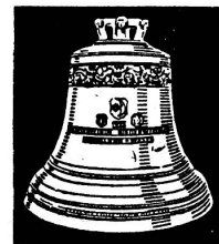
Glockengiesserei Staad bei Rorschach