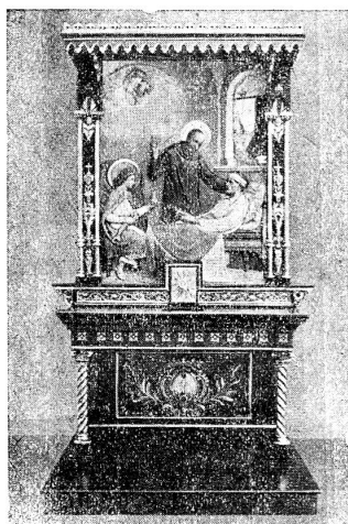
Altar ausgeführt für die Kapelle der Apotheke des Vatikans, Rom 1929.

Skizzen, Modelle u. Offerten zu Diensten.