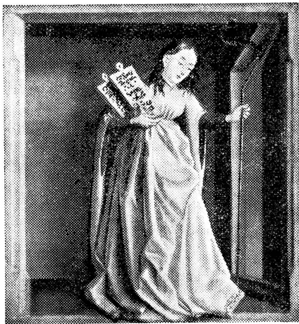
Konrad Witz: Die Synagoge