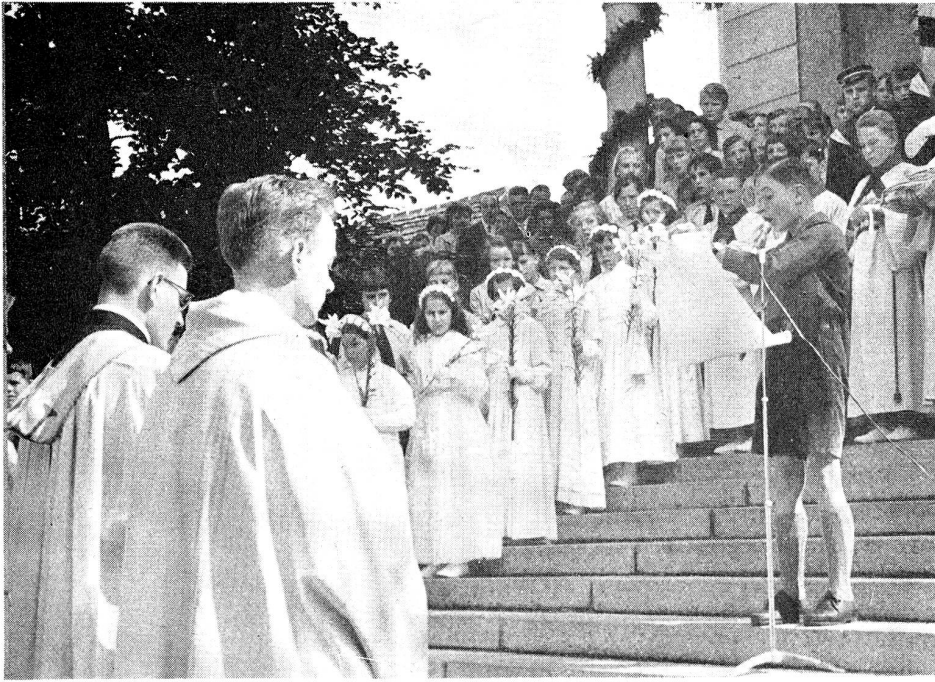
Gebetsbitte der Jungvacht auf der Kirchentreppe vor dem Primizamt

schah in frühern Zeiten häufiger, den Dienern des Altars Brot und Wein...» Der eingeschaltete Opfergang war erlebnismäßig neben der Consecratio wohl der Höhepunkt der Primizmesse. Acht Opfergaben, die direkt oder wenigstens indirekt mit der Eucharistie in Beziehung standen, wurden prozessionsweise, abgestuft nach dem Wertrange, durch Diakon, Subdiakon und Ministranten vom Kirchenschiff zum Altare getragen: Wein, Wasser, Weihrauch, Brot für die Waisenkinder, das Kirchenopfer, Primizkelch, Patene und Ziborium.