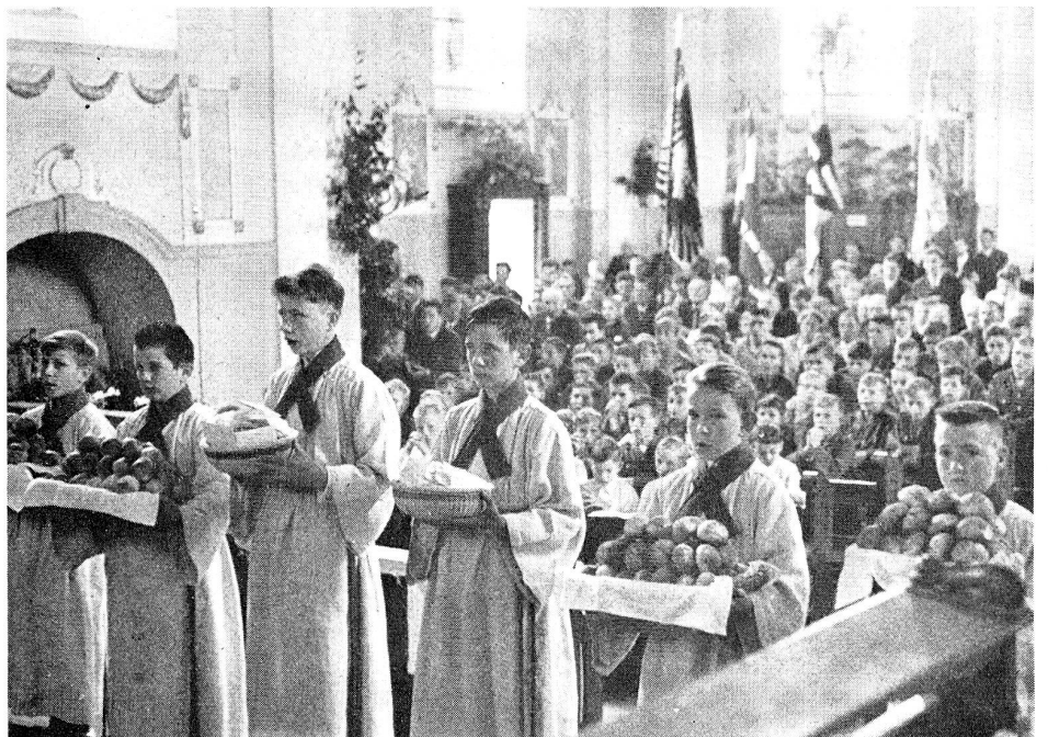
Opfergang. Die Armengabe

Vorbeter: Für unsern Mitbruder NN., der vor 51 Jahren primizierte und heute als Benediktinermönch in Rio de Janeiro wirkt.