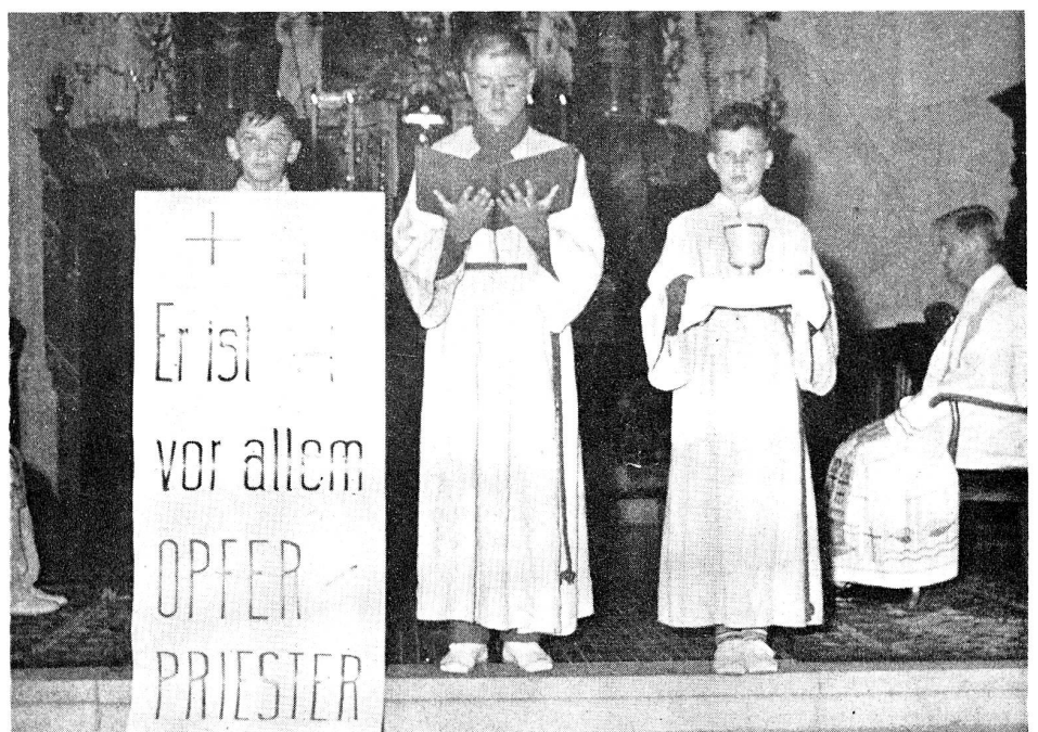
Begrüßungsgottesdienst: Leser, Gaben- und Schriftrollenträger

Die erwähnte Enzyklika nennt auf S. 39/40 auch den Opfergang . «Sodann bringen die Gläubigen manchmal, und es ge-