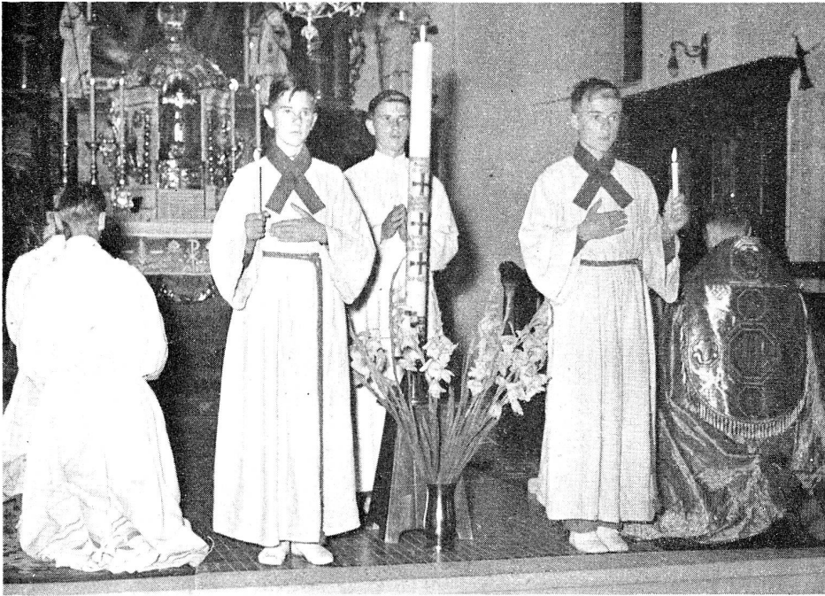
Abendfeier. Gedenken der lebenden Priester

Diakon: Daß der ewige Hohepriester ihn in der Liebe und Treue zum Priestertum bewahren und bestärken möge!