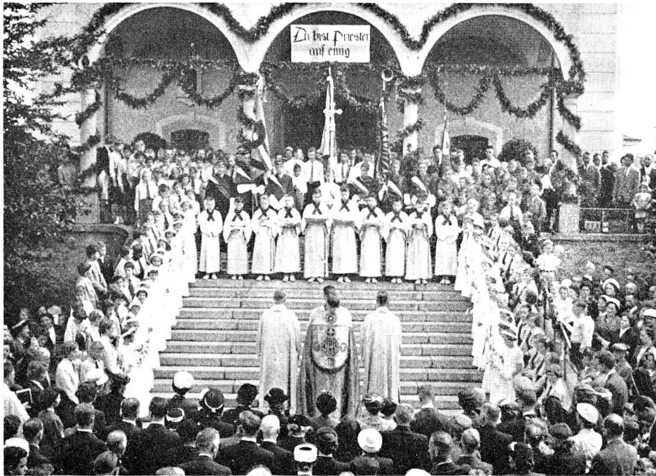
Begrüßungs- und Einkleidungsfeier auf dem Kirchplatz

für das Erlebnis des Gnadentages innerlich disponieren. Mit andern Worten: die quecksilbrige Vorstadtjugend sollte nicht zerstreut, gedankenlos ins große Geheimnis einer ersten Messe hineinstürzen. Bewußt wurde die Gestaltung der Feier fast ausschließlich durch die Jugend, besonders die Ministranten selber bestritten (siehe Jungmann, Katechetik, S. 207). Die Erkenntnisse der heutigen Pädagogik und Psychologie wurden berücksichtigt. Zum rezeptiven Aufnehmen kam das produktive Mittun, zum Sprechen das innerlich beruhigende Schweigen und Überdenken. Das gesprochene Wort wurde durch diskret gehaltene Anschauung ergänzt. Eine Vielzahl von mitgestaltenden Personen sollte gemeinschaftsverbindend und die absichtlich betonte äußere Feierlichkeit innerlich begeisternd wirken.